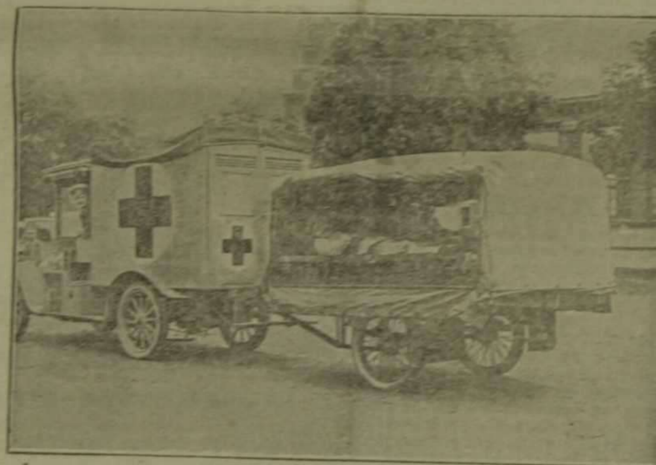
Del servicio de transportes en el territorio oriental.—Un auto alemán al servicio de la Sanidad militar.

Un pueblo intervenido y subyugado, que ve su independencia constantemente amenazada, no tiene derecho a detenerse a pensar en la pobre Bélgica, en la heroica Serbia, en los vínculos de solidaridad latina, ni en las razones de justicia y derecho que acompañan a la causa germanista.