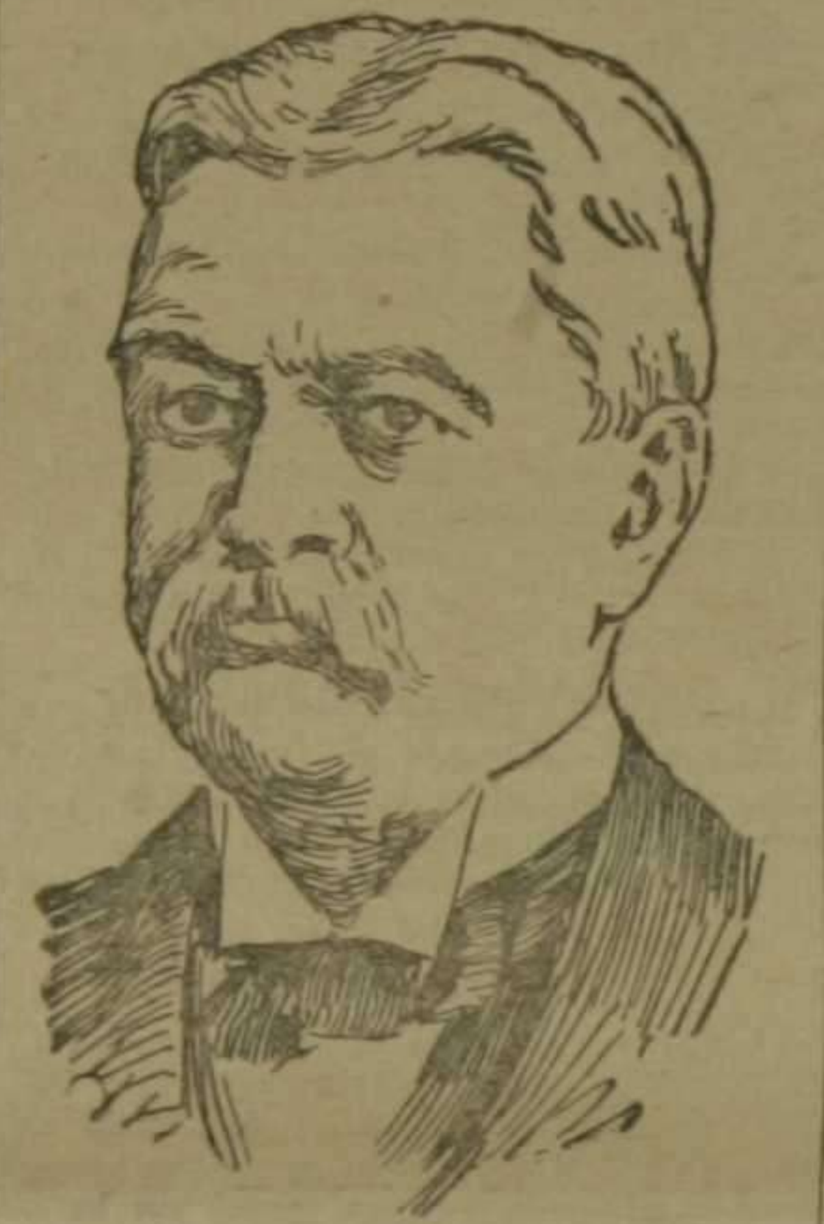
Baron de Marschall Antiguo embajador de Alemania en Constantinopla, a quien se indica para suceder en breve a von Bethmann Hollweg, en la cancillería del imperio

Benedicto XV puede emplearlo, porque más que una potencia de la tierra, representa una potencia del cielo.