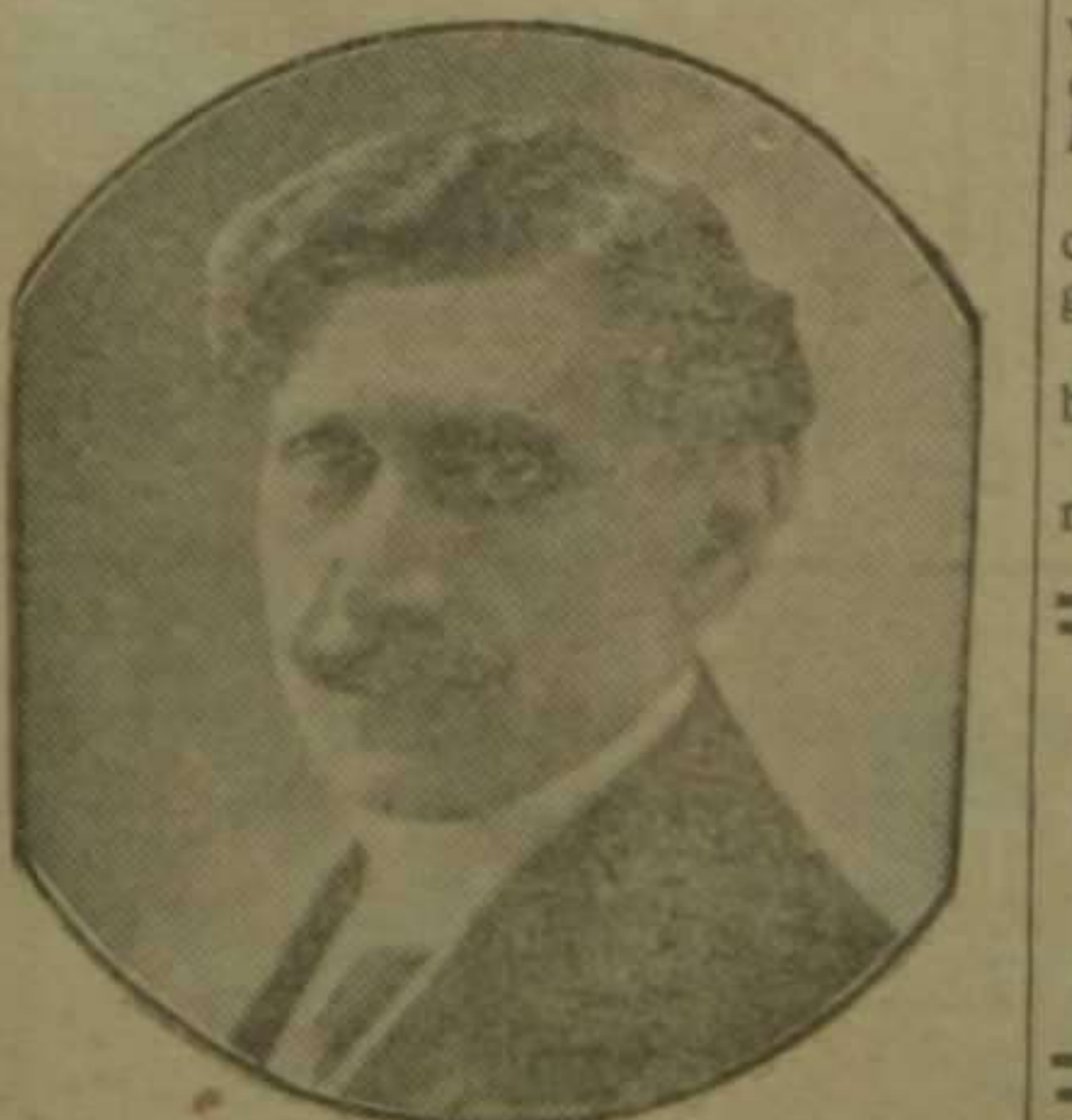
Onofroff Famoso hipnotizador, que debuta mañana en el teatro Apolo

Nada más elocuente y expresivo que este diálogo, en el que aparecen retratados de cuerpo entero la devoción y fe de un general desprecupado, y el desinieres de un humilde exclaustroado.