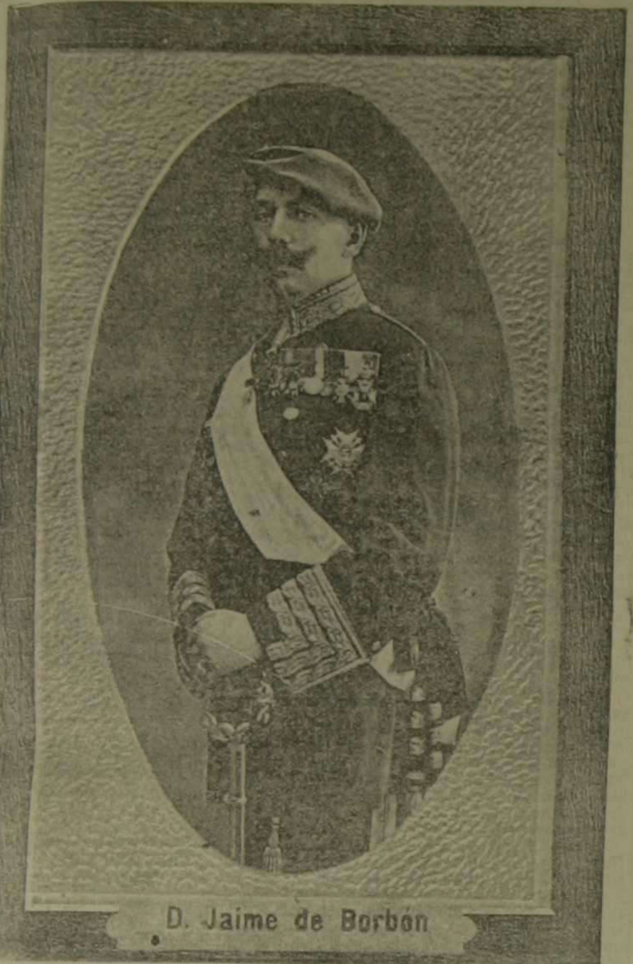
D. Jaime de Borbón