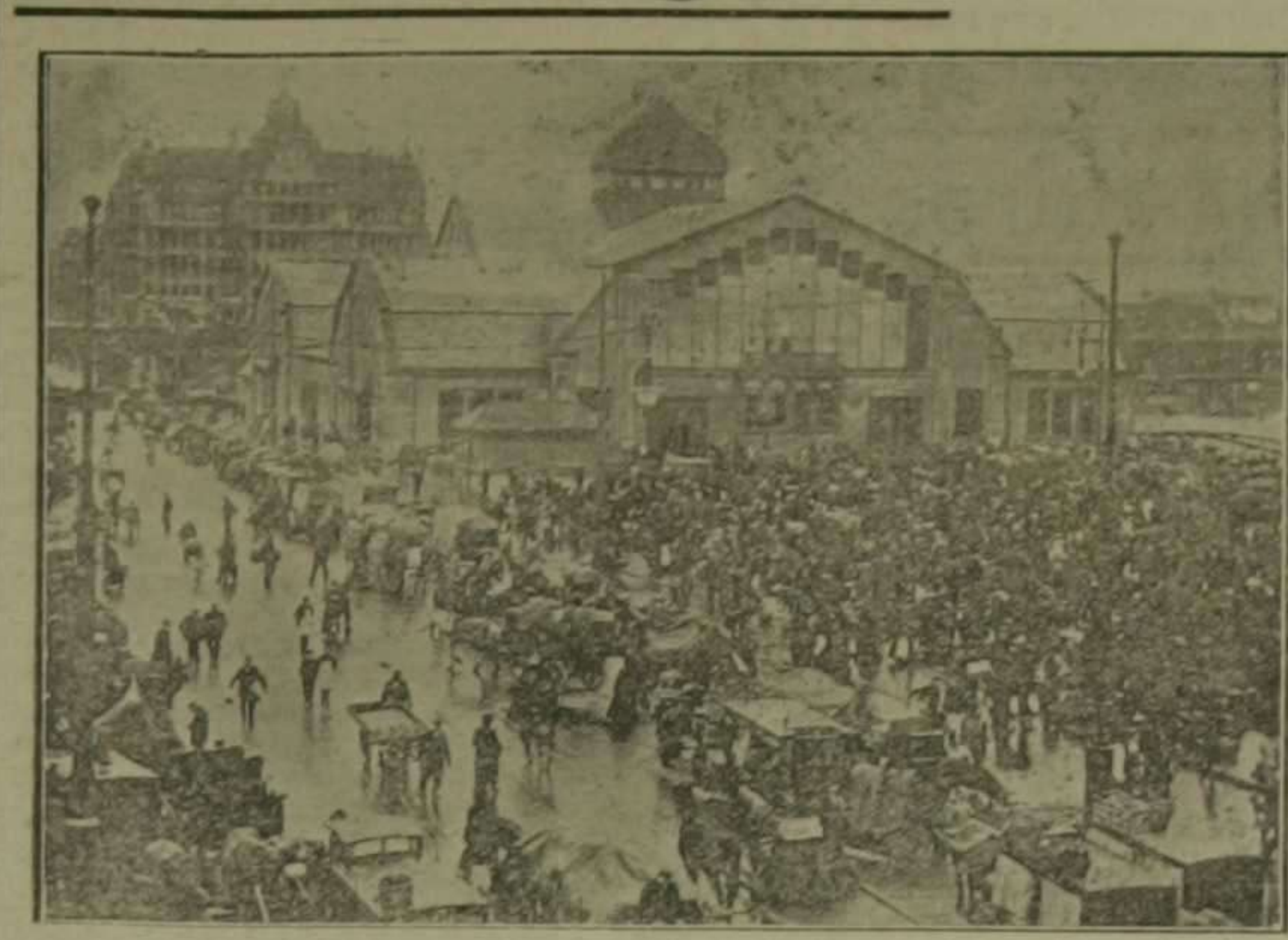
Vida y movimiento en el mercado de legumbres de Hamburgo durante la guerra. Dicho mercado es uno de los mayores en su clase en Alemania