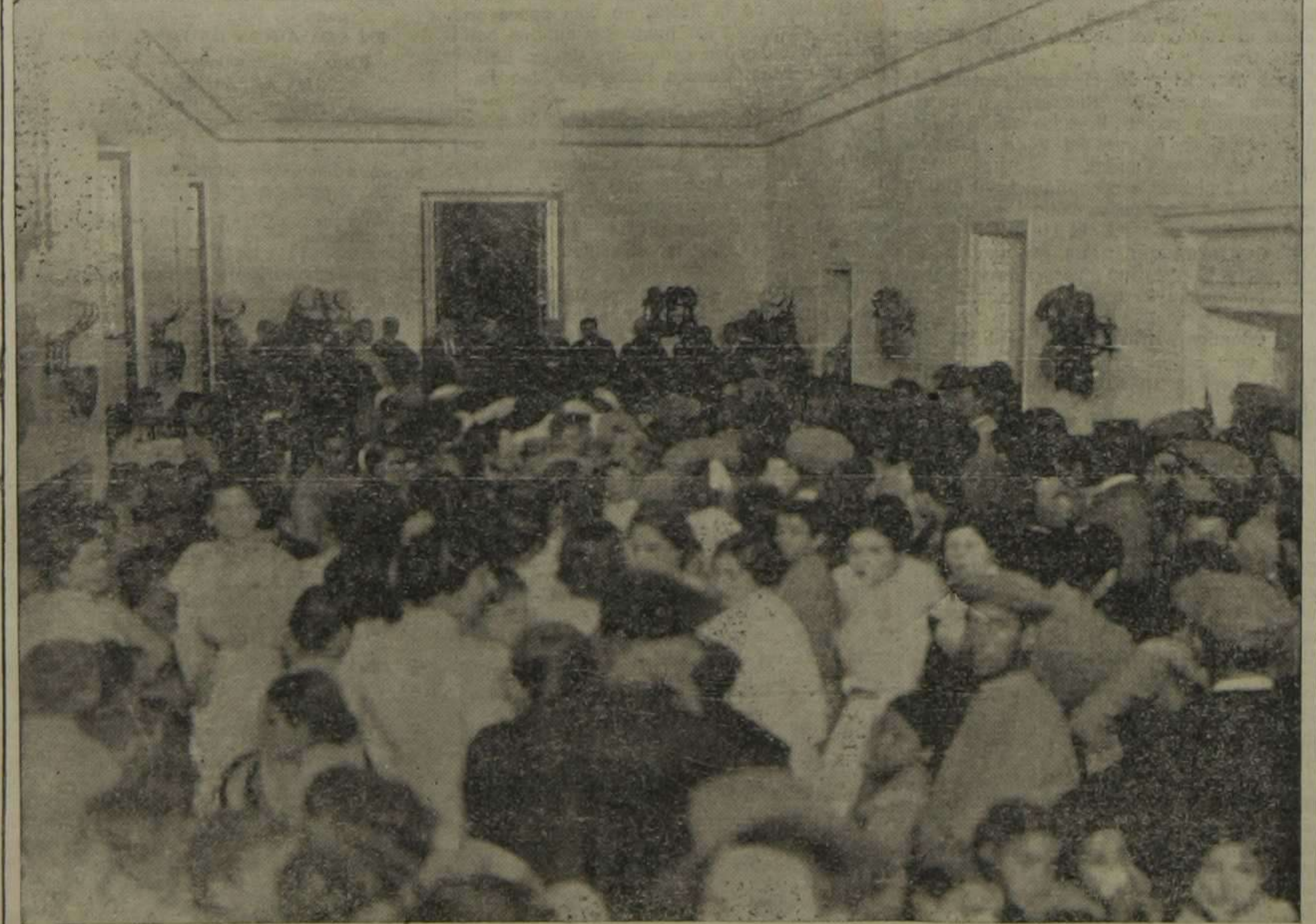
VINALES.—Aspecto del nuevo Centro cooperativo La Unión, recientemente inaugurado. Léase la reseña en otra página del periódico.

Con que, a cobrar y que de provecho les sirva.