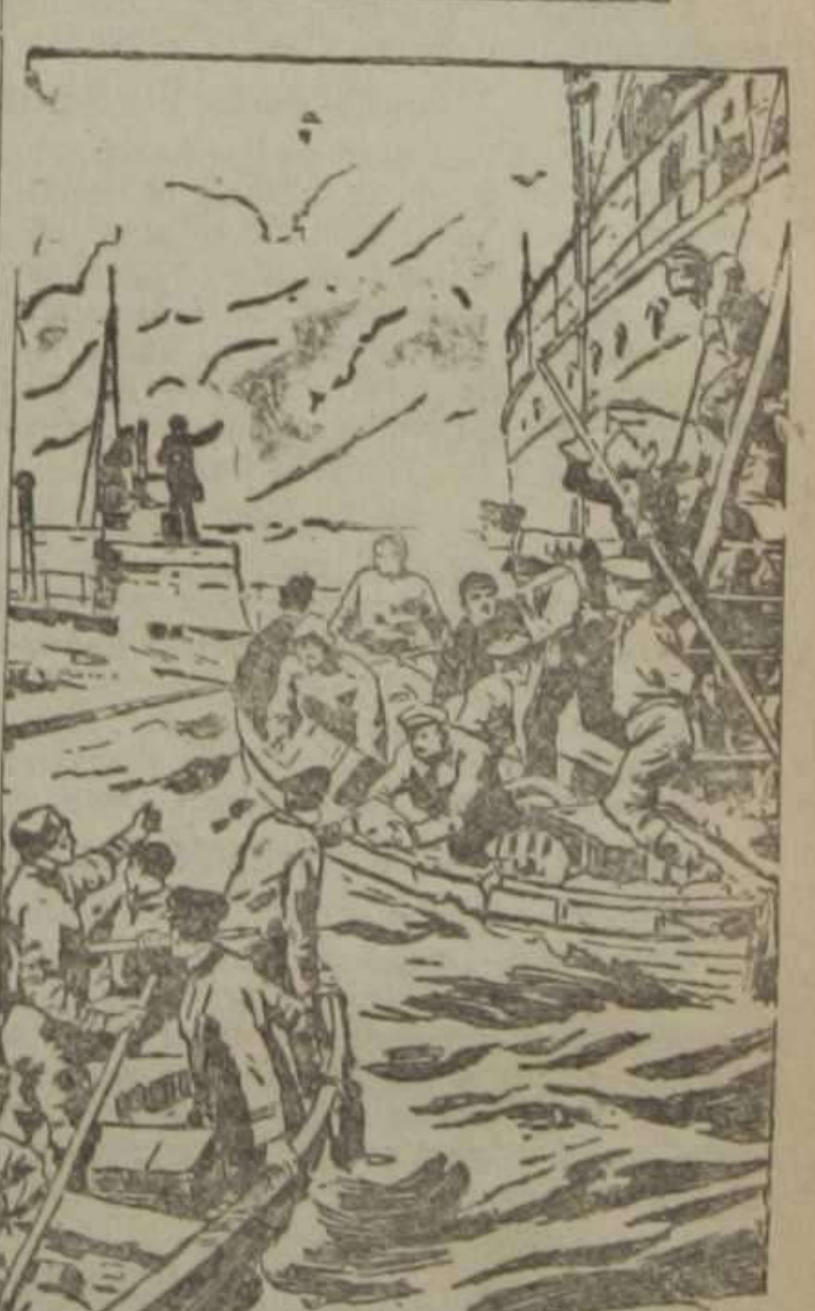
La tripulación de un barco inglés abandonando éste momentos antes de ser hundido por un submarino alemán

No menos dura que la terrestre es la guerra que se desarrolla en el mar. Desde que Alemania declaró campo de guerra todos los mares que bañan costas inglesas, excluyendo el canal de la Mancha, respondiendo así al bloqueo declarado por Inglaterra, raro es el día que los submarinos tontos no hundan algún barco mercante. Los submarinos detienen a todos los vapores y veleros que encuentran, sin excluir a los de los países neutrales, y después de conceder un período de tiempo que nunca pasa de diez minutos, para que tripulantes y pasajeros se pongan en salvo, dispara un torpedo contra la nave detenida, que desaparece para siempre. Desgraciadamente, en no pocas ocasiones son sacrificadas algunas víctimas, que van a aumentar el tremendo número de las que lo son en los campos de batalla.