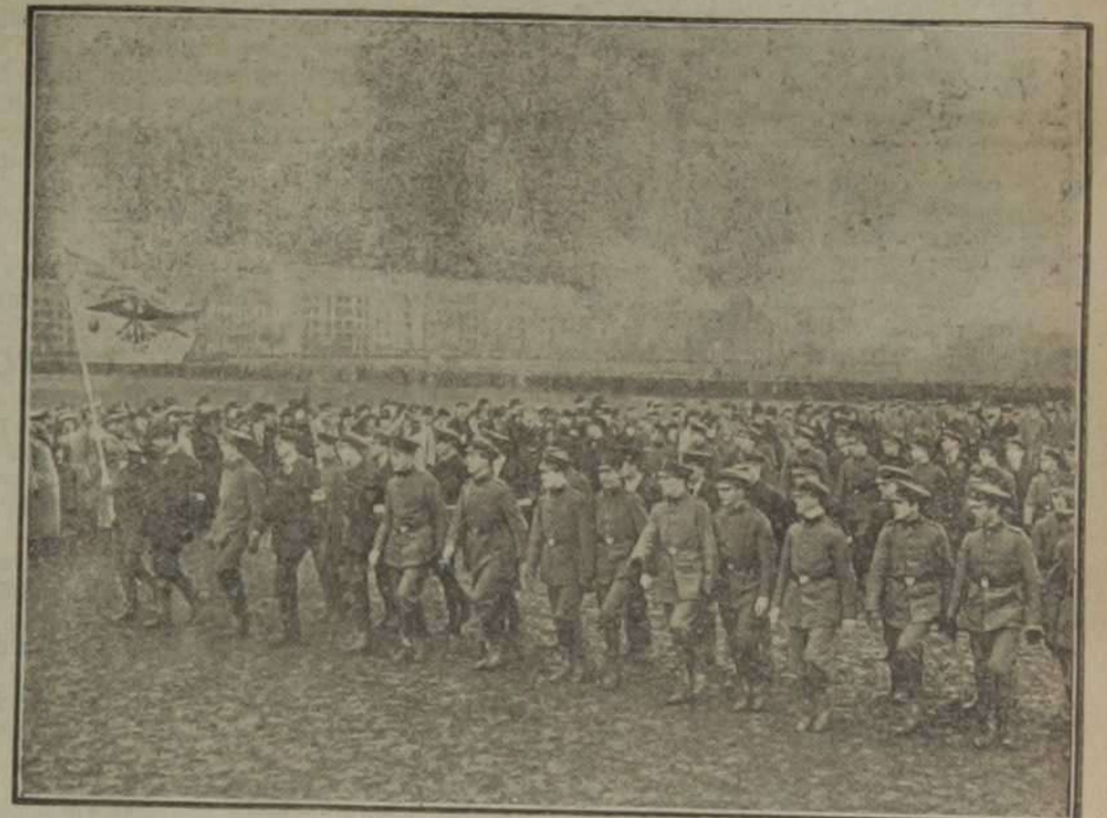
Desfile de los jóvenes alemanes que reciben instrucción militar como preparación para el porvenir, por delante de sus protectores