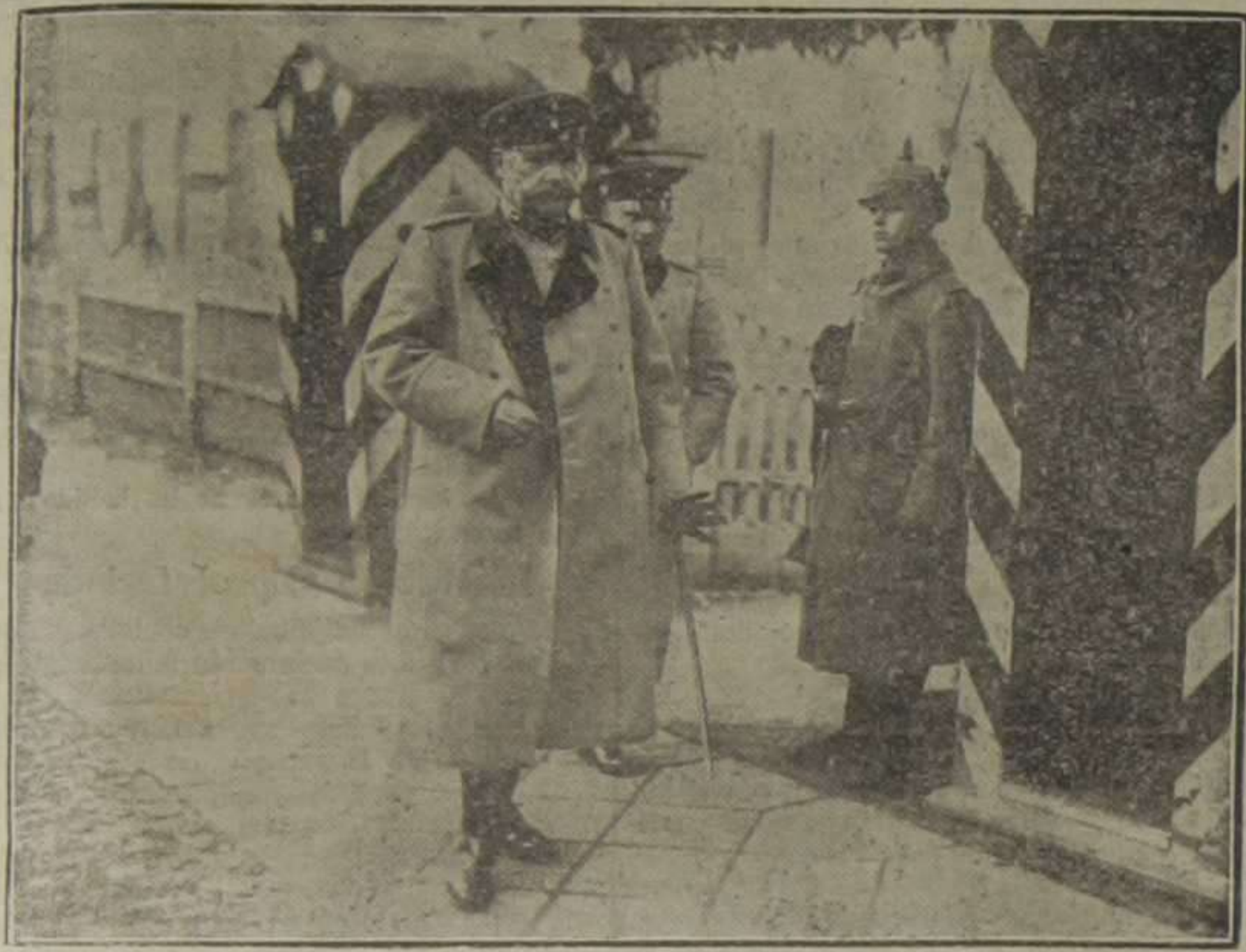
Último retrato del general en jefe del ejército alemán en Oriente, mariscal de campo von Hindenburg