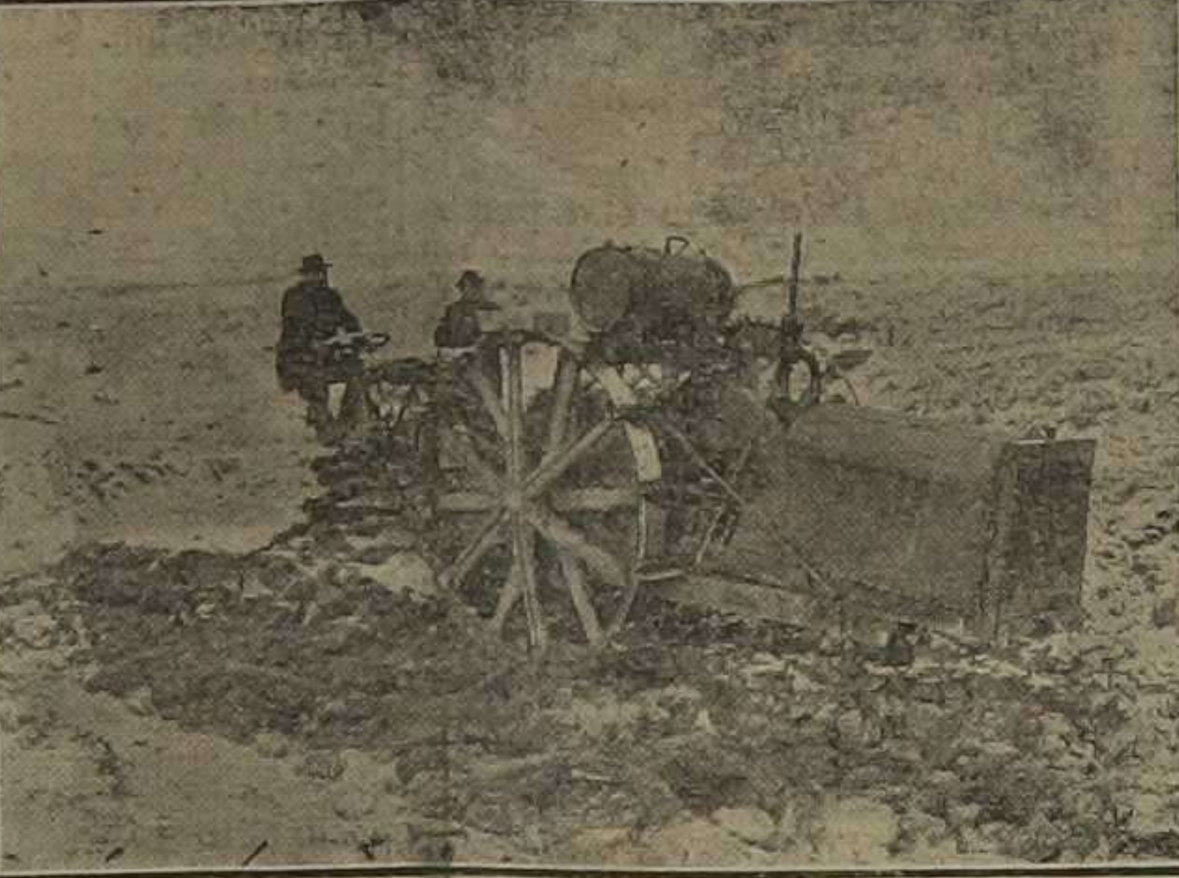
Un arado movido a vapor labrando el campo de Tempelhof, reservado hasta ahora para hacer maniobras militares