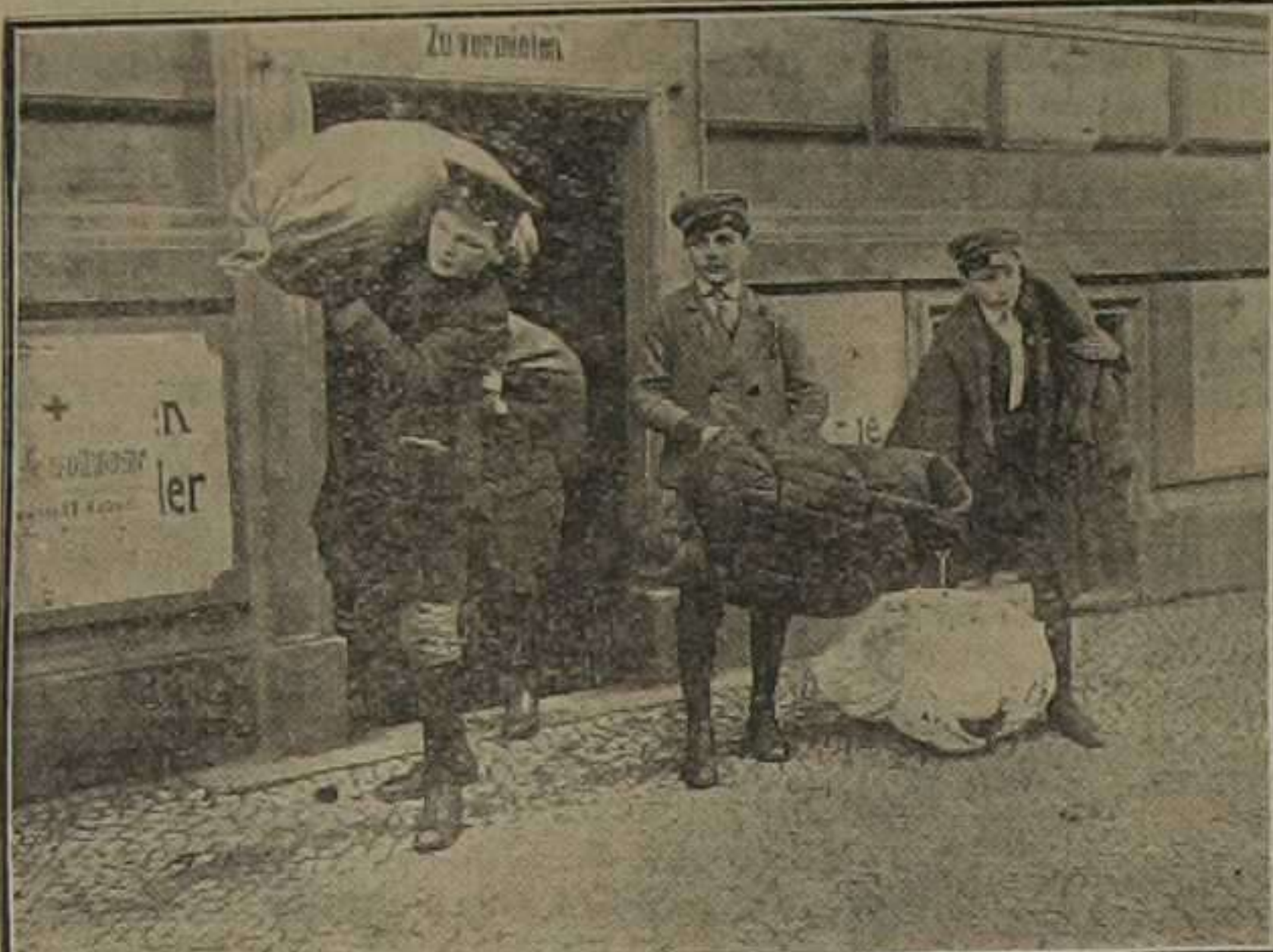
Alumnos de las escuelas, ayudando a transportar al depósito central las existencias de lana

¡Lección sublime de abrazos de cultura en estos días de odios implacables! Debería celebrarse en Valencia con brillo y esplendor. La juventud animosa y entusiasta, de corazón noble y ardiente, de fe robusta y alentadora, de frente despeja-