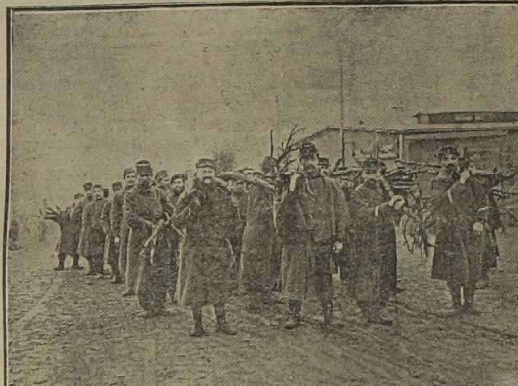
Prisioneros en el campamento de Zossen (Alemania) trayendo leña para calentarse sus barracas