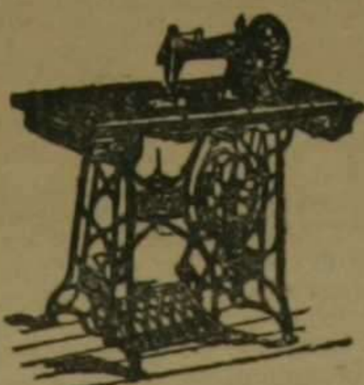
Nuestra bobina central es la única que bordea sin cambiar piezas; sólo con tocar un resorte queda en disposición de bordar.

Pl y Margall, núms. 12 y 14. Teléfono 48. Valencia