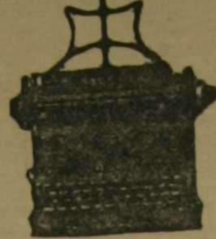
Stower Record. Escritura visible, magnífica y perfecta mente alineada con cambios de rapidez.