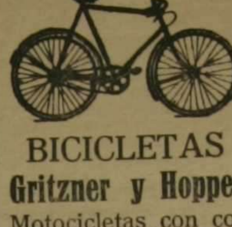
BICICLETAS Gritzner y Hopper. Motocicletas con cochecho al lado 4, HP. pesetas 1.900