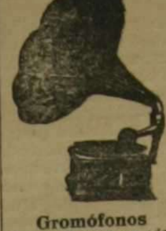
Gromófonos. Desde 50 pías en adelante, de las mejores marcas conocidas hasta la fecha. Discos

Rectilíneas Walter. Grandísimas para hacer calceta y fabricación de géneros de punto. Gran surtido en agujas, piezas sueltas y accesorios de todos sistemas.