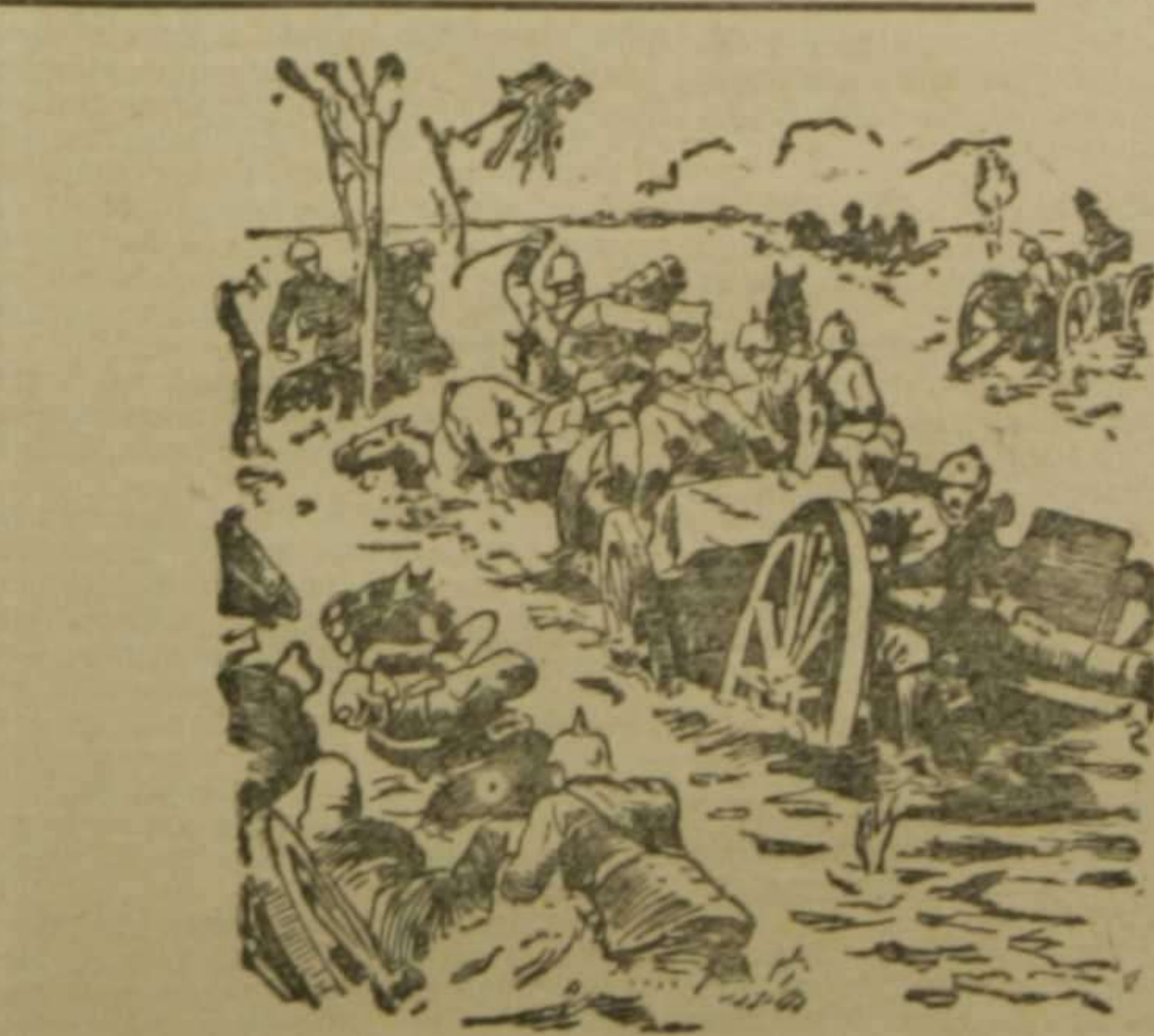
Una batería alemana poniéndose a salvo de la inundación provocada por los aliados en la región de Ipres