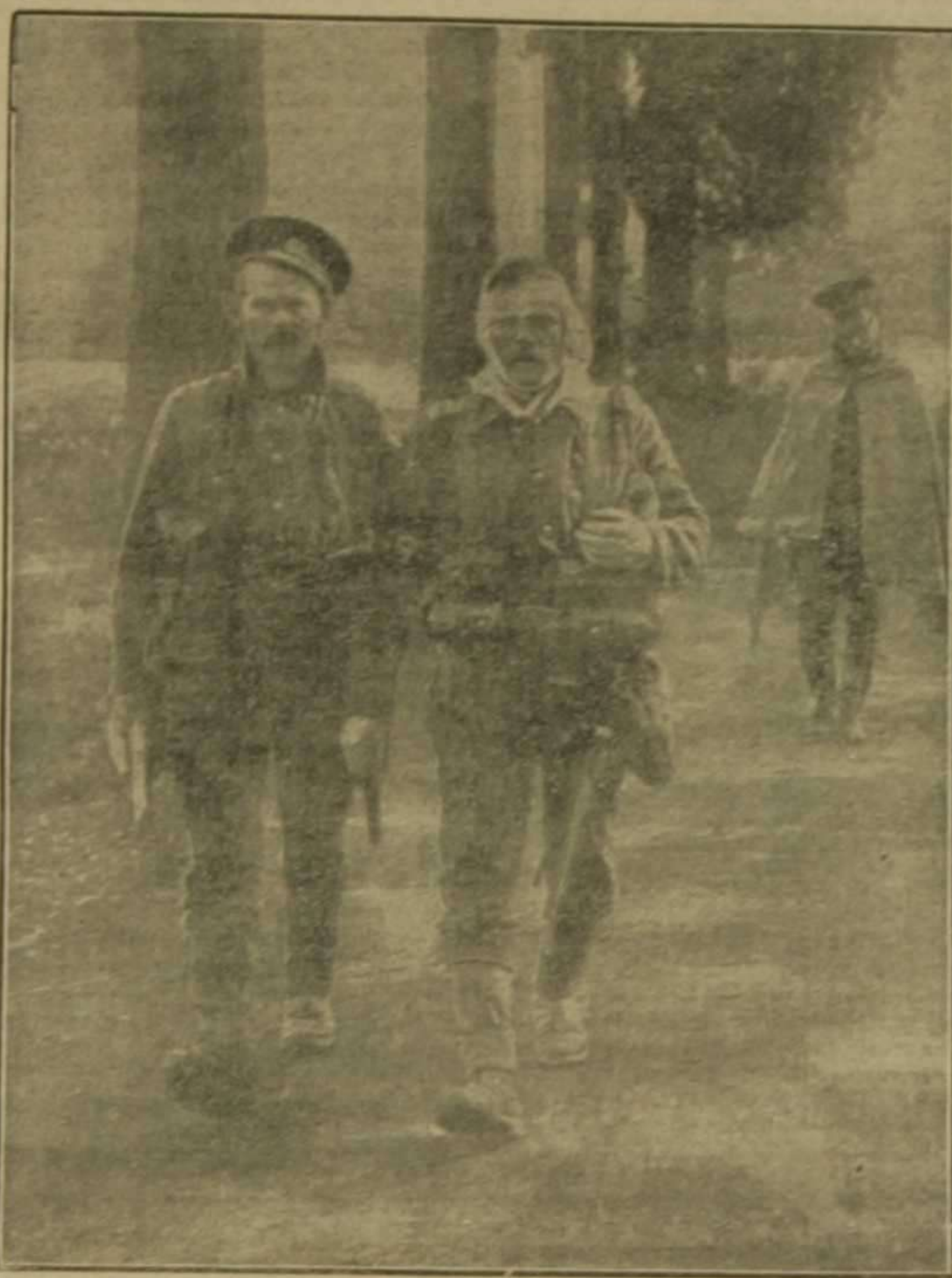
Soldado inglés herido conducido a la ambulancia de La Cruz Roja

El capital francés en Turquía. Si, hay que reconocerlo, pese a las simpatías de raza que pueda inspirarnos el pueblo francés, Francia es el país que, entre los que actualmente se hallan en guerra, más honrosos quebranlos sufre en su vida económica y financiera. Además de los graves daños sufridos por los departamentos fronterizos con Alemania y Bélgica, y de los experimentados por la industria francesa en general, sufre hoy otro de suma importancia, con motivo del ingreso de Turquía en el conflicto europeo.