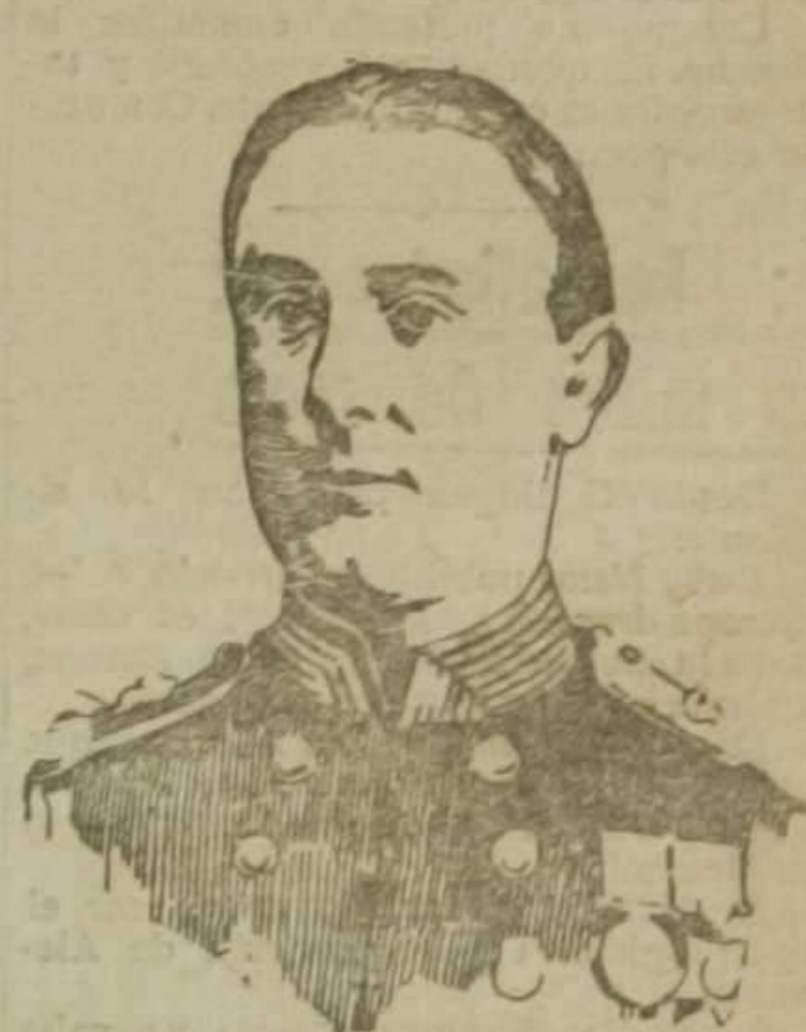
Sir John Jellicoe, comandante en jefe de la flota inglesa del mar del Norte