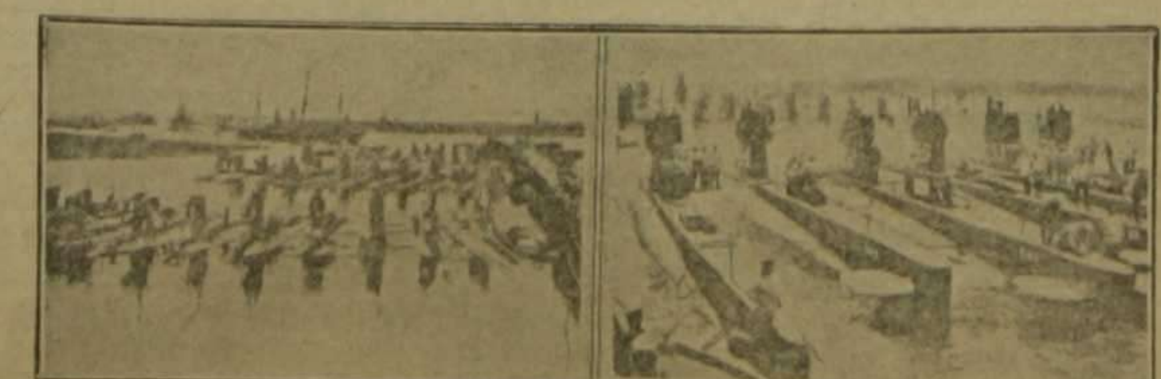
Escuadrillas de submarinos en el puerto y prontos a zarpar

Esta porción visible está en gran parte ocupada por una especie de plataforma, en la cual, y aproximadamente hacia su centro, se levanta la torrecilla de observación. Esta tiene el aspecto de un pequeño quiosco circular, poco más o menos de la altura de un hombre, y lleva en su parte superior, cerca del techo, varias ventanillas acristaladas. De lo más alto de la torrecilla sobresale, a manera de cañón de chimenea, en casi todos los sistemas de submarinos, el tubo del periscopio u omniscopio, aparato cuyo objeto veremos más adelante. A cierta distancia de la to-