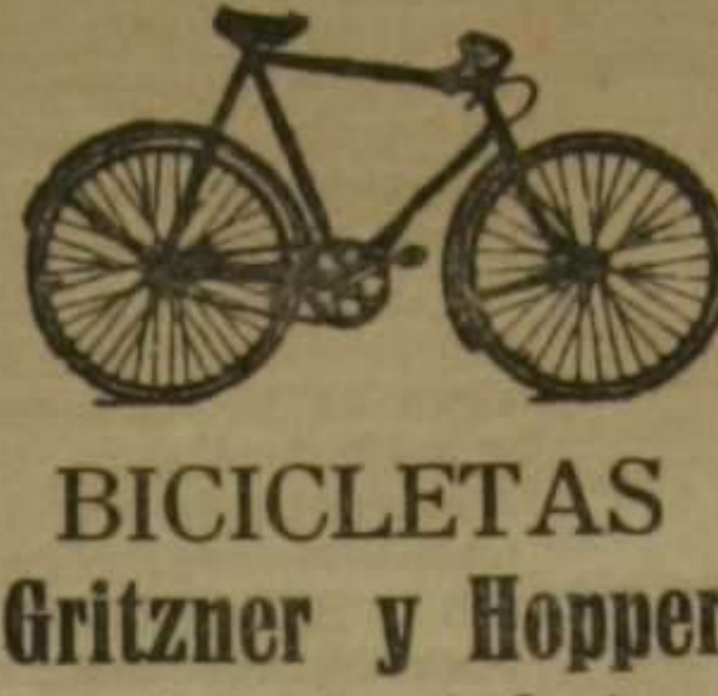
BICICLETAS Gritzner y Hopper Motocicletas con side-car