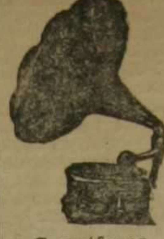
Gromófonos Desde 50 pías. en adelante, de las mejores marcas conocidas hasta la fecha. Discos

Rectilíneas Walter. Grandiosa para hacer calceta y fabricación de géneros de punto. Gran surtido en agujas, piezas sueltas y accesorios de todos sistemas.