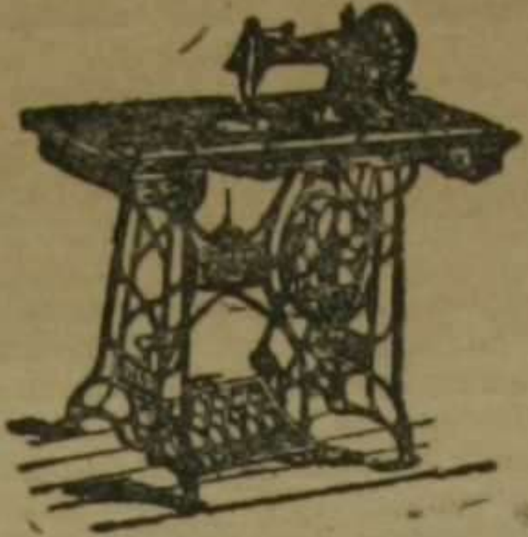
Nuestra bobina central es la única que bota sin cambiar piezas; sólo con tocar un resorte queda en disposición de bordar.

Pi y Margall, núms. 12 y 14. Teléfono 48