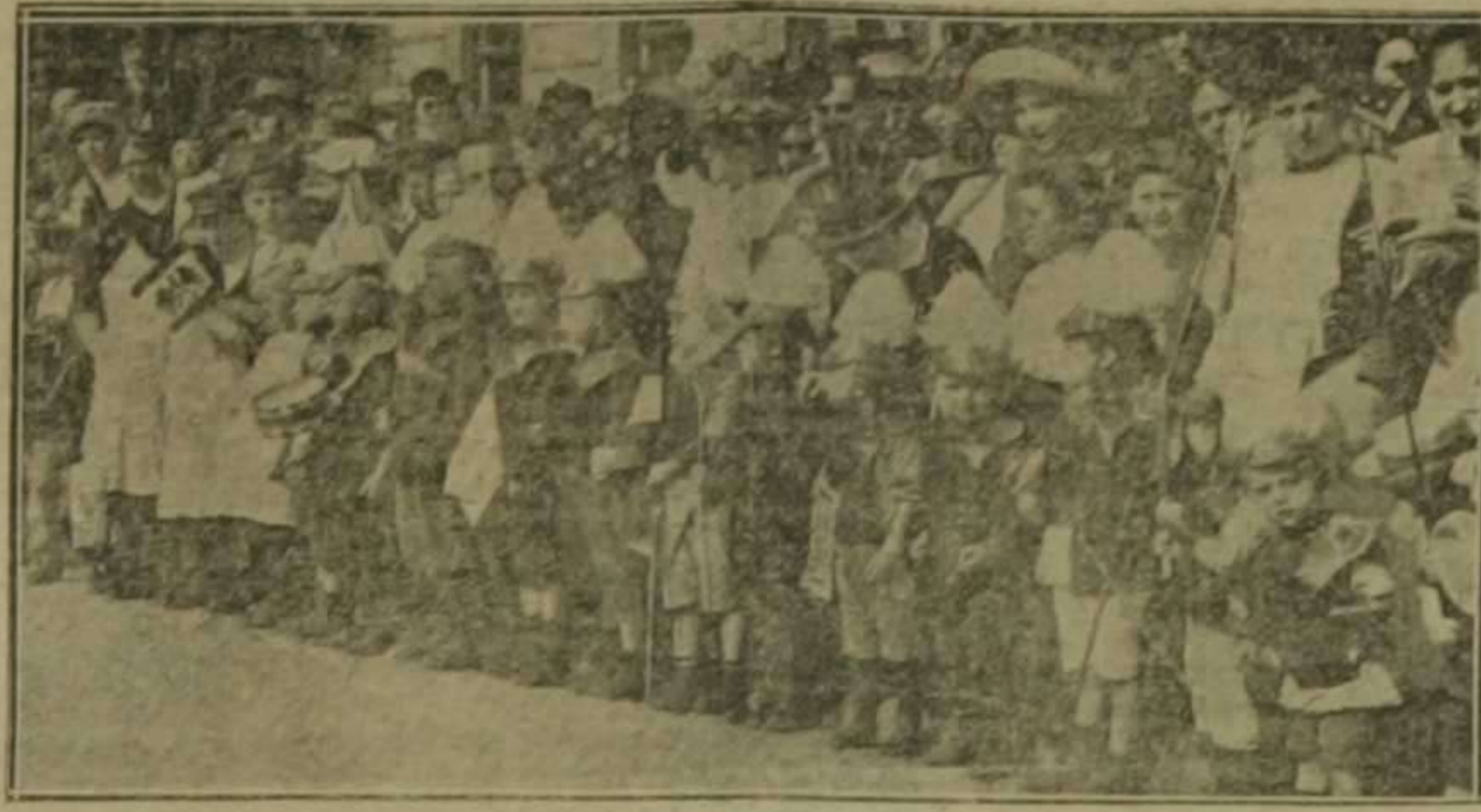
Berlín.—Un batallón infantil entre el numeroso público que espera la entrada de los cañones tomados por las tropas alemanas

más de seis horas, esperando, impaciente y anhelosa, la señal de ataque contra el enemigo.