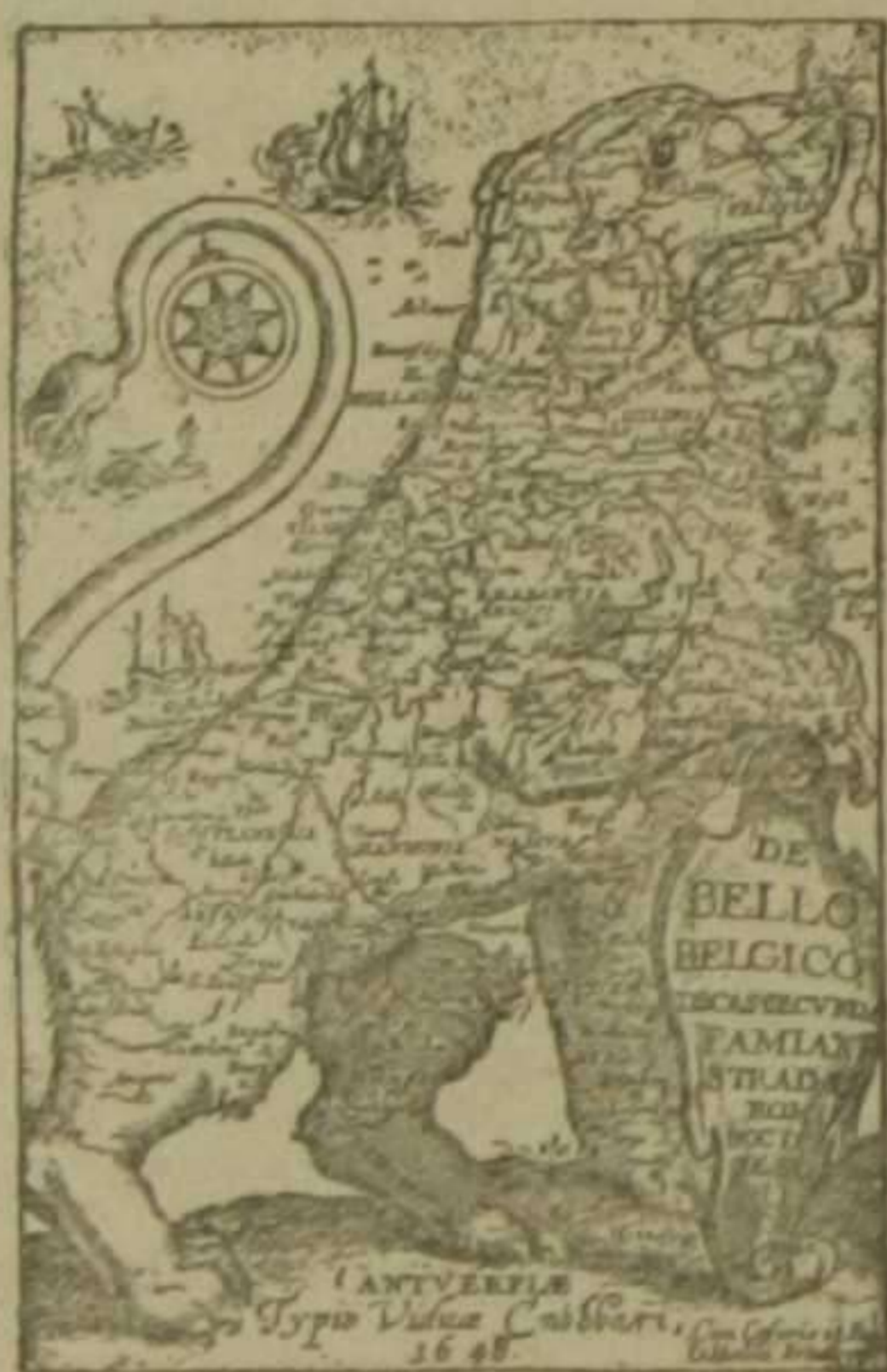
Reproducción de la portada de una obra belga del siglo XVII, impresa en Amberes.