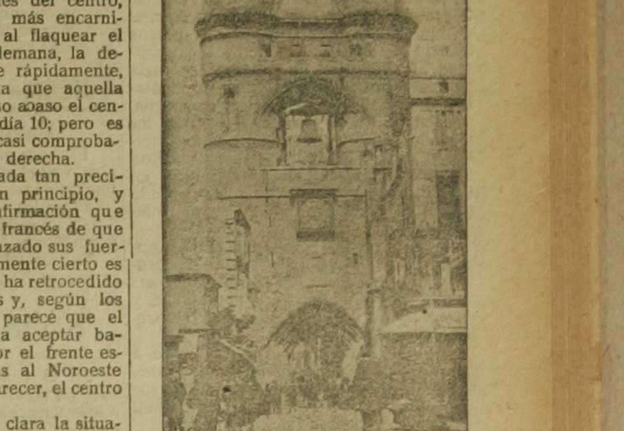
Burdeos.—El campanario de la iglesia de San Eloy

Los japoneses en Kiao-Tcheu Por impresiones recibidas de Tokio por The Daily Telegraph puede asegurarse que los que esperaban la rápida conquista por los japoneses del territorio alemán de Kiao-Tcheu sufrirán, probablemente una desilusión. A lo que parece, el Japón se moverá lenta y metódicamente, reduciendo en lo posible las pérdidas de hombres y procediendo con miras más encaminadas al problema futuro que al presente.