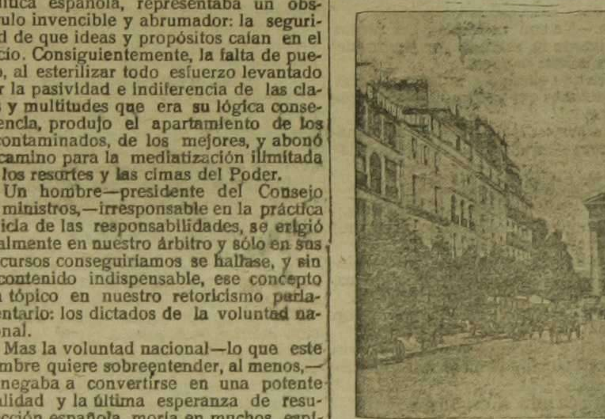
París.—La calle Real, con la hermosa Iglesia de la Magdalena al fondo

laborioso, ve con honda pena la guerra, como necesidad suprema de vida, confiado tranquilo en la victoria, inspirado en el más elevado y santo amor patrio.