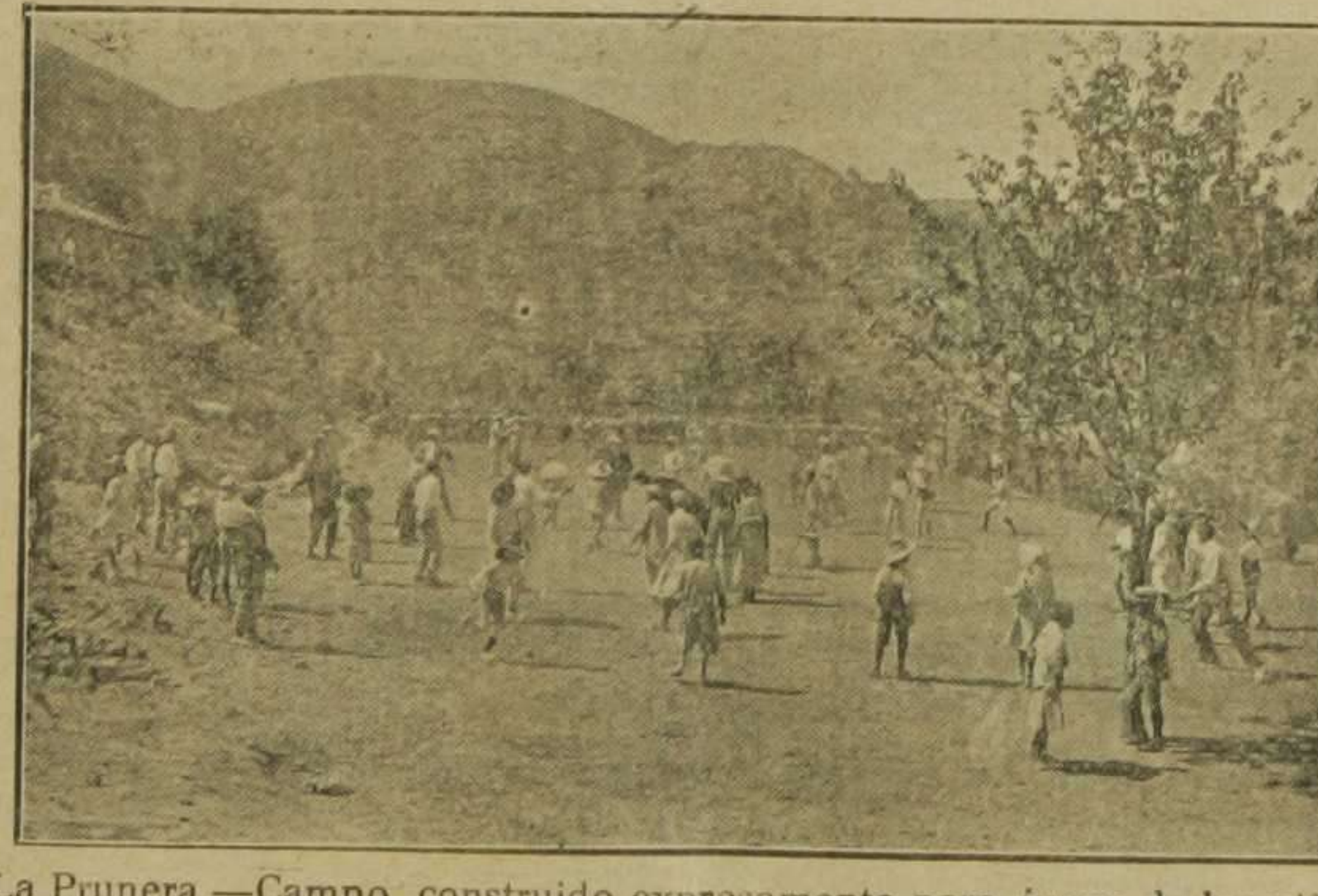
La Prunera.—Campo construido expresamente para juego de los niños, inaugurado este verano

Como en años anteriores, el Patronato de la Juventud Obrera ha organizado en el presente la excursión de sus alumnos al campo, en donde han disfrutado las delicias de la vida campestr. La casa de San José, en La Prunera, ha albergado desde Julio a la fecha 261 aprendices enfermos pertenecientes a las escuelas nocturnas y niños de diversas escuelas, tanto públicas como privadas. Para que nuestros lectores puedan apreciar la bondad higiénica de estas colonias diremos que de los 261 niños, 49 han aumentado más de tres kilos; 98, más de dos kilos, y 114 uno o poco menos. Otro dato no menos interesante: 141 niños han logrado desarrollar su capacidad física en más de dos centímetros; 120 en más de uno. Los medios empleados por el Patronato han sido: Una casa grande, propia, sana, buen sitio y extensa, a 600 metros sobre el nivel del mar. Duchas, buen aire y mejor agua. Comida buena y abundante. Paseos, juegos, baños de sol y alegría continua. La Colonia envía por nuestro conducto el testimonio de su más sincera gratitud a sus protectores y nosotros, en nombre de los protectores y en el propio, enviamos nuestra más cordial enhorabuena a la Junta de las Colonias escolares por sus desvelos en beneficio de la juventud.