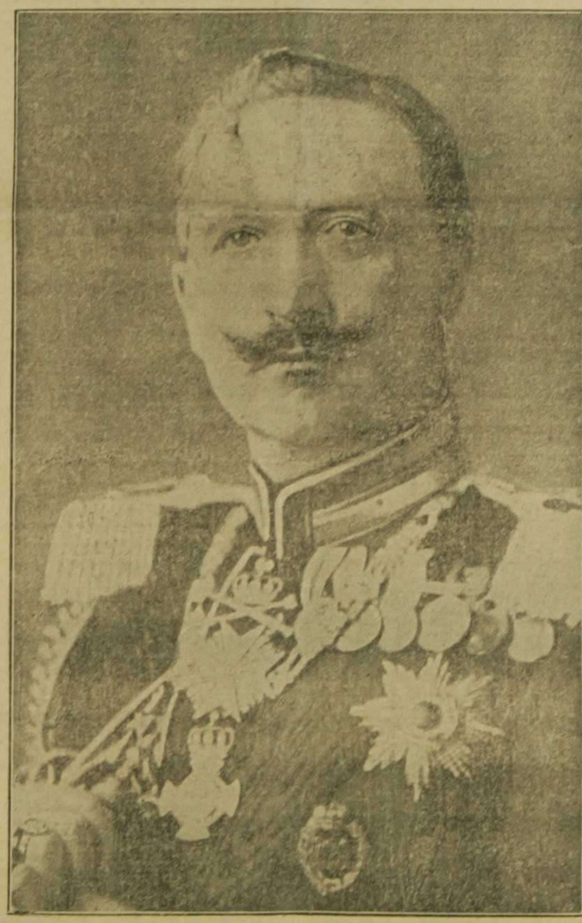
El kaiser Guillermo II de Alemania

¿Qué clase de democracia es esta? ¿Qué ventajas obtiene ni puede obtener el verdadero pueblo, ese pueblo que paga y que trabaja, de semejante democracia?