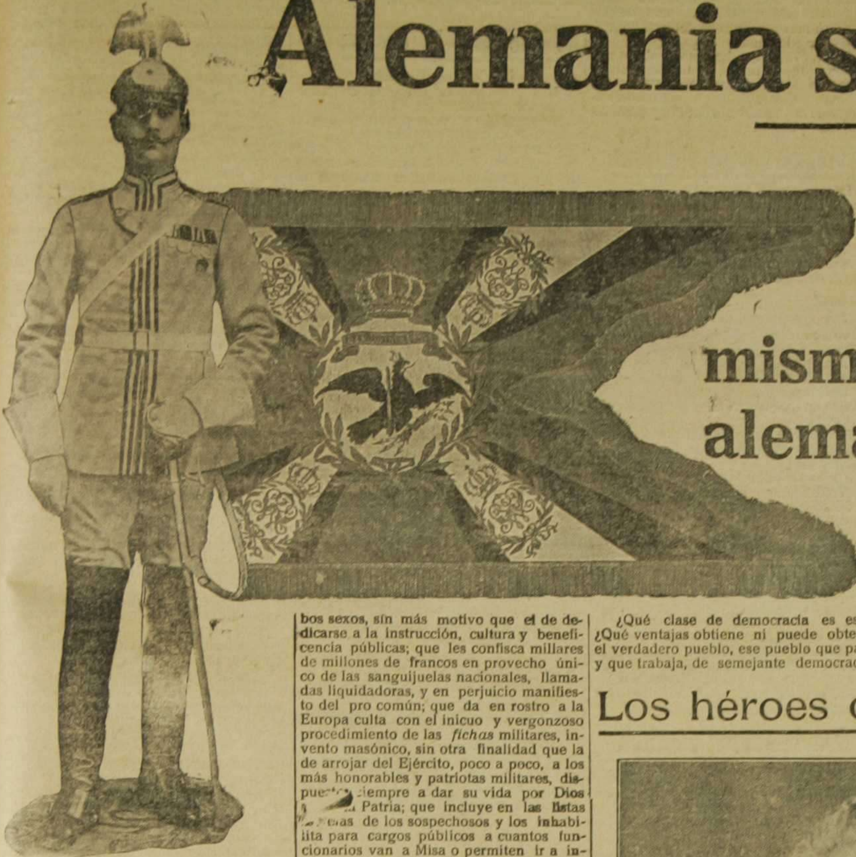
Guardia de Corps, del cortejo del Kaiser.—Estandarte del regimiento alemán de husares, número 6.

A pesar de todas las afirmaciones francesas y por ellas mismas, confirmamos el triunfo alemán sobre las fuerzas aliadas