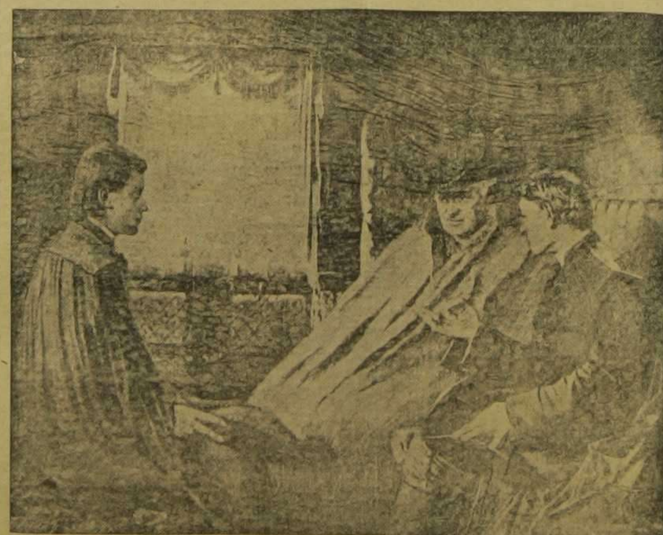
Un Cardenal de viaje para asistir al Cónclave.—(Dibujo de Hellbrth.)