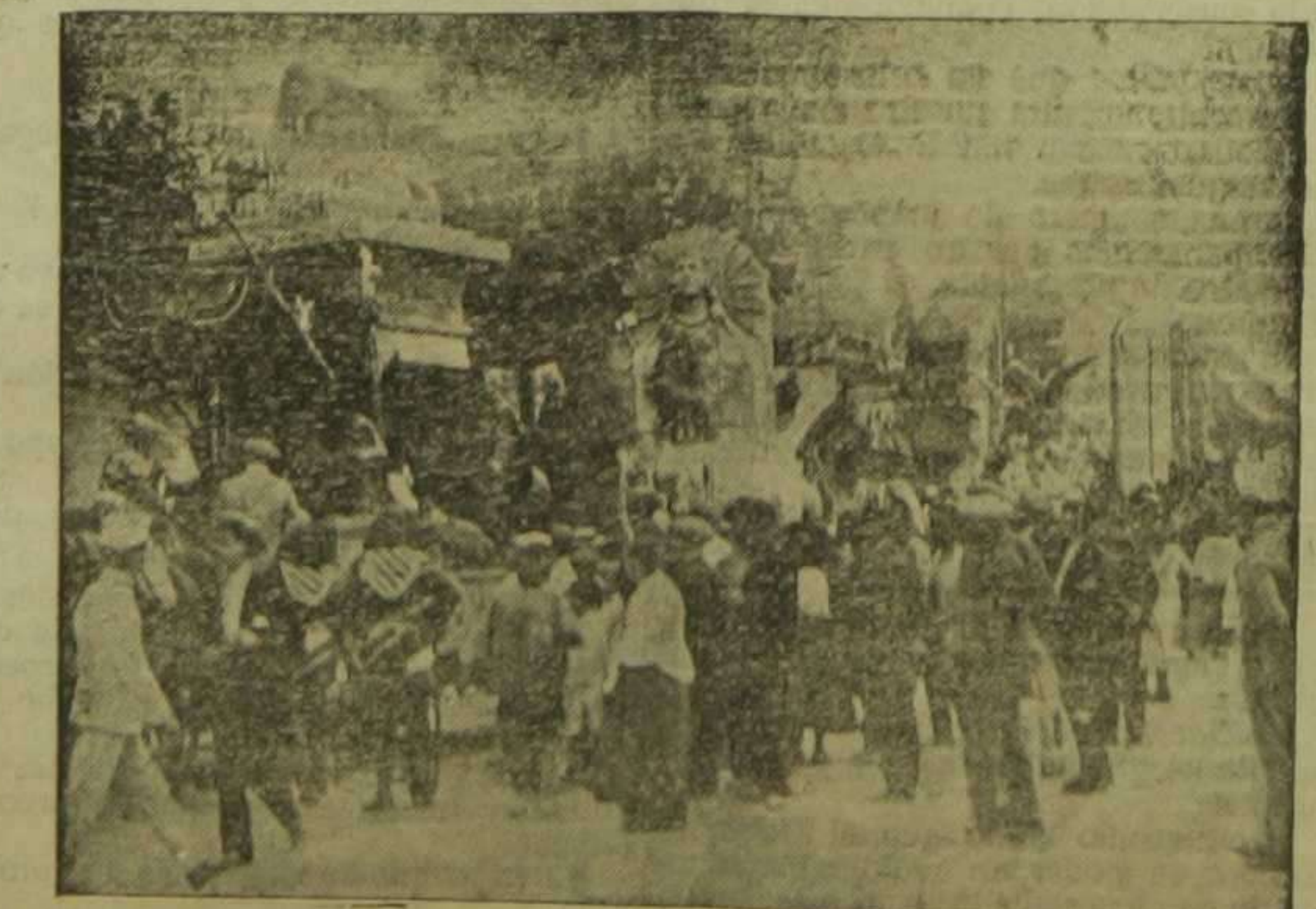
La Cabalgata que ayer tarde recorrió la ciudad. (Véase la reseña en tercera página)

Las tropas de la Rusia europea (excepto las del Cáucaso) están repartidas en siete grandes circunscripciones militares, que son como sigue: