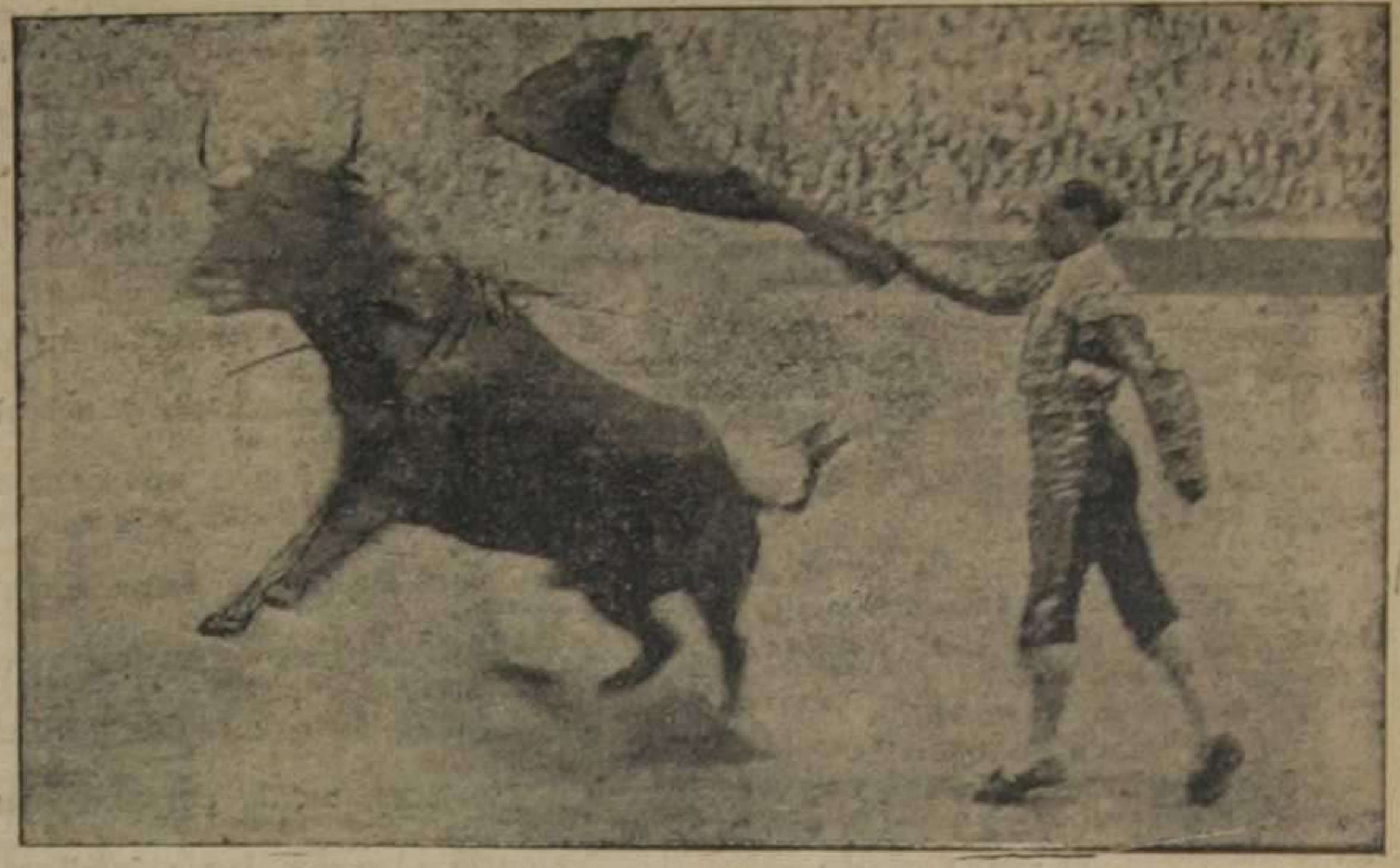
Gallo grande en un pase a su toro.