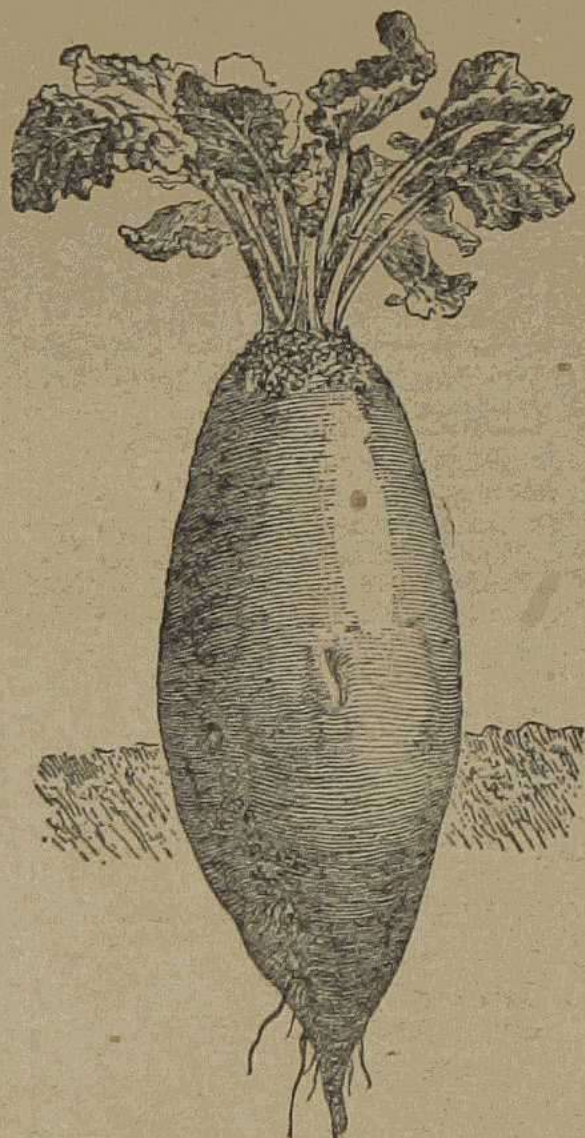
Remolacha gigante de Vauriac

Olivos de todos tamaños. Semillas frescas de remolachas forrajeras, tres variedades extra, tres ptas. kilo.