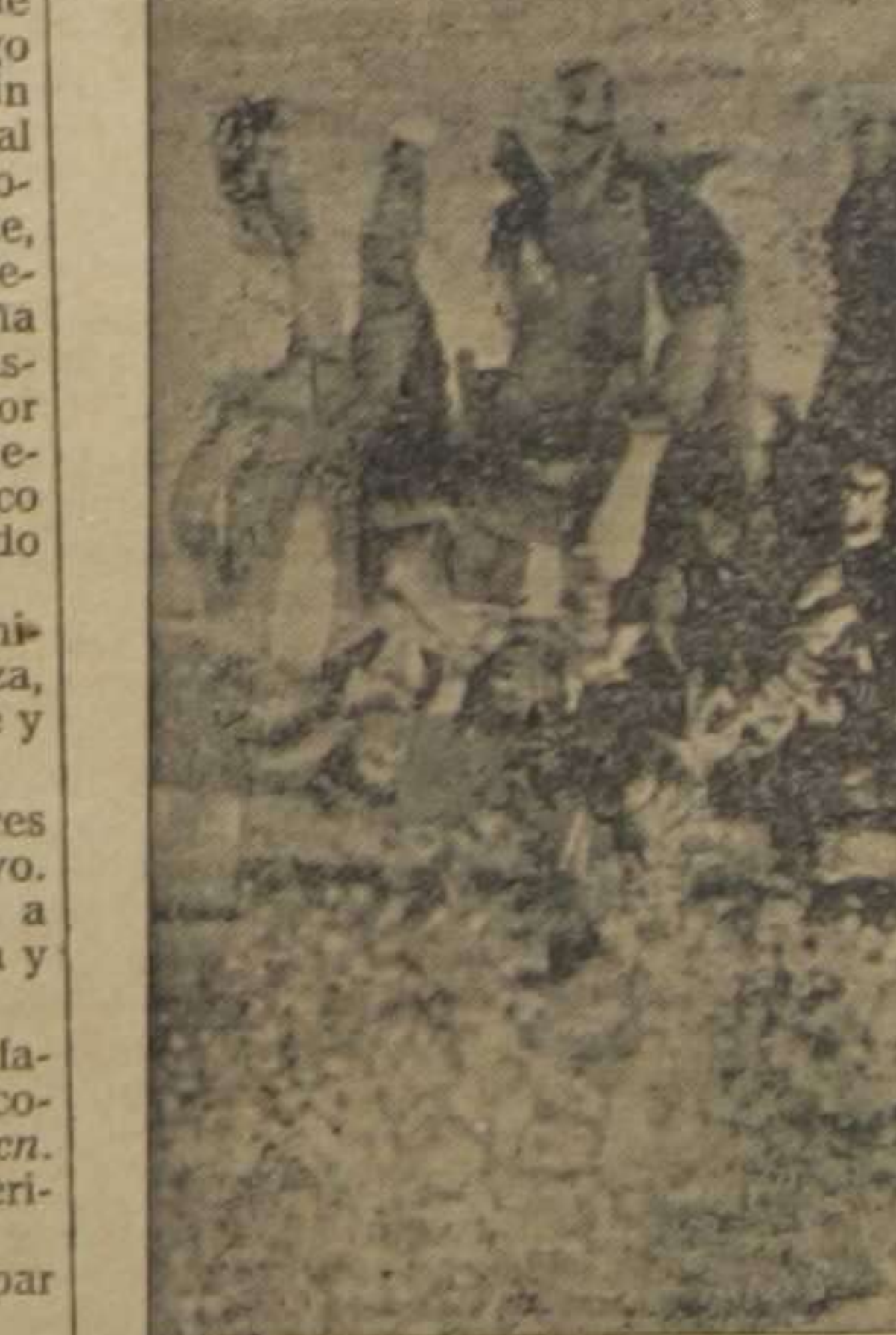
Cortijano paseado por el ruedo en hombros después de la muerte del primer toro. Es el primer caso que se presencia en esta Plaza.

Salió el sexto, que en el lado derecho llevaba lo suyo y una daga florentina en el izquierdo.