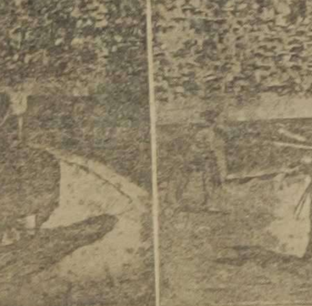
Las habilidades de Belmonte.—Dos pases de muleta de su especialidad.

paseándole a hombros por el anillo antes que acabara la corrida.