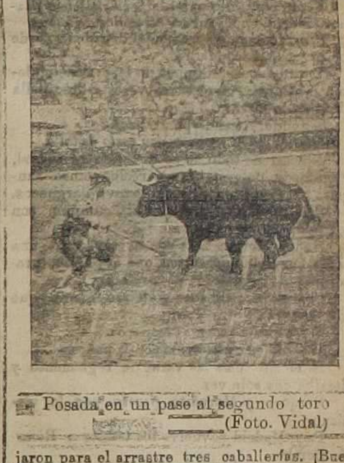
Posada en un pase al segundo toro.

De lo contrario, podremos decir que su fronto era tan desahuciable como las pompas de jabón.