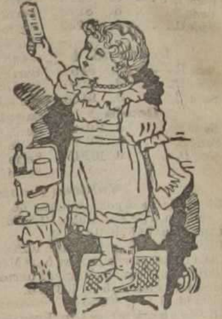
Después de tomar la dentina

Venta: Farmacias y droguerías, y en la Farmacia y Laboratorio de esterilización de Cañizares.-Abierta toda la noche.-Calle de San Agustín, 63, VALENCIA.