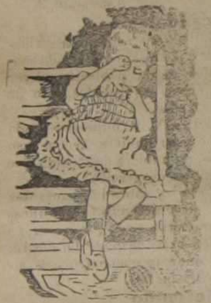
Antes de tomar la dentina