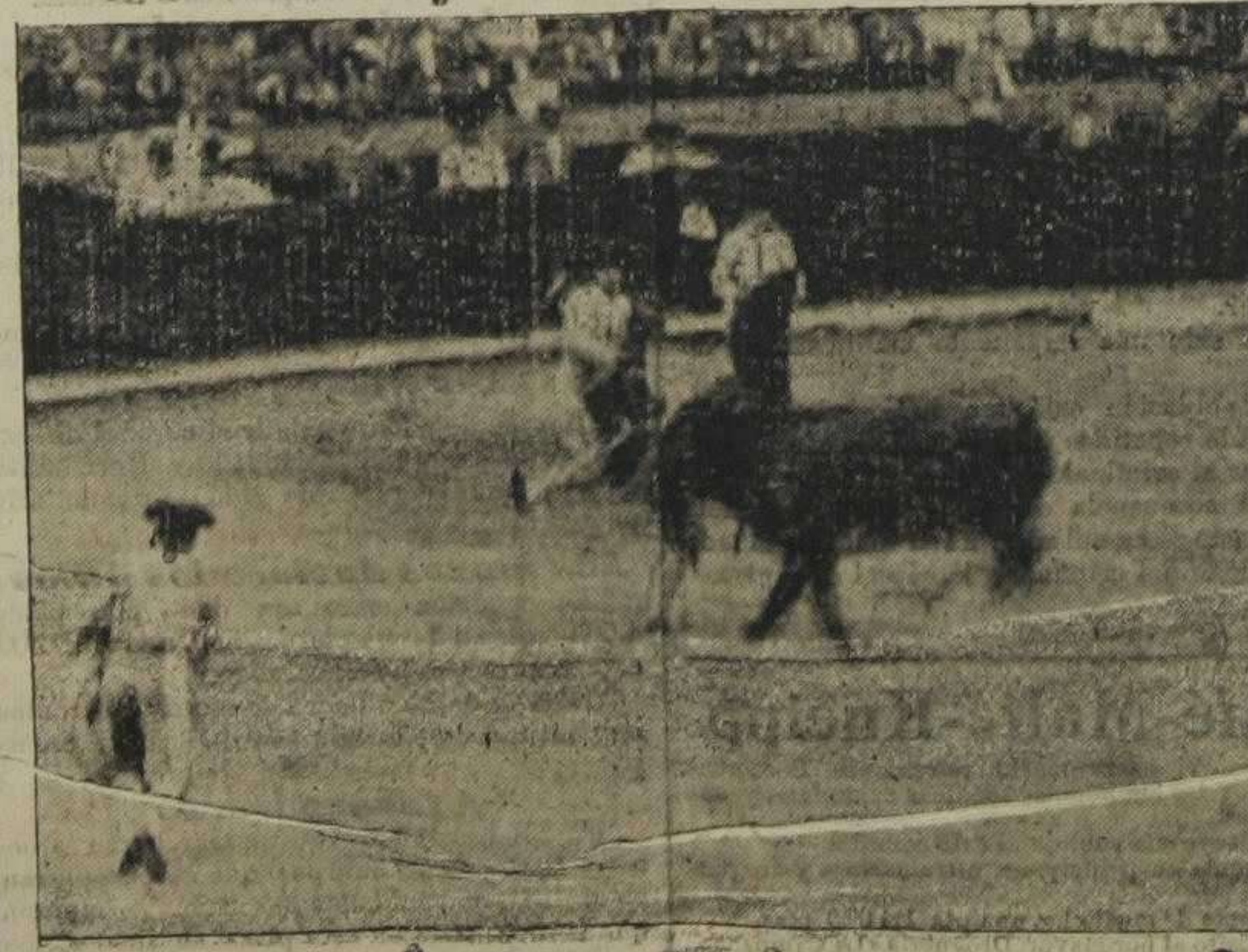
Cogida de Gaona.—(tomada desde la meseta del toril, porque en el callejón... ¡no cabe ya más gente!)

Y de hermosa lámina, pero mansurrón, el último, cárdano número 20. Mi toro; ese era mi toro! Está demostrado, no puede uno fiarse, por su aspecto, de los cornúpetos, ni de los empresarios.