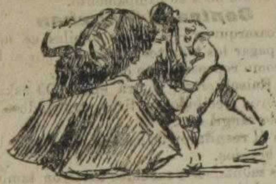
Gallito en su segundo.