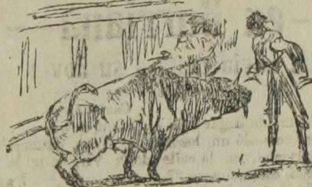
Gaona en el primero.