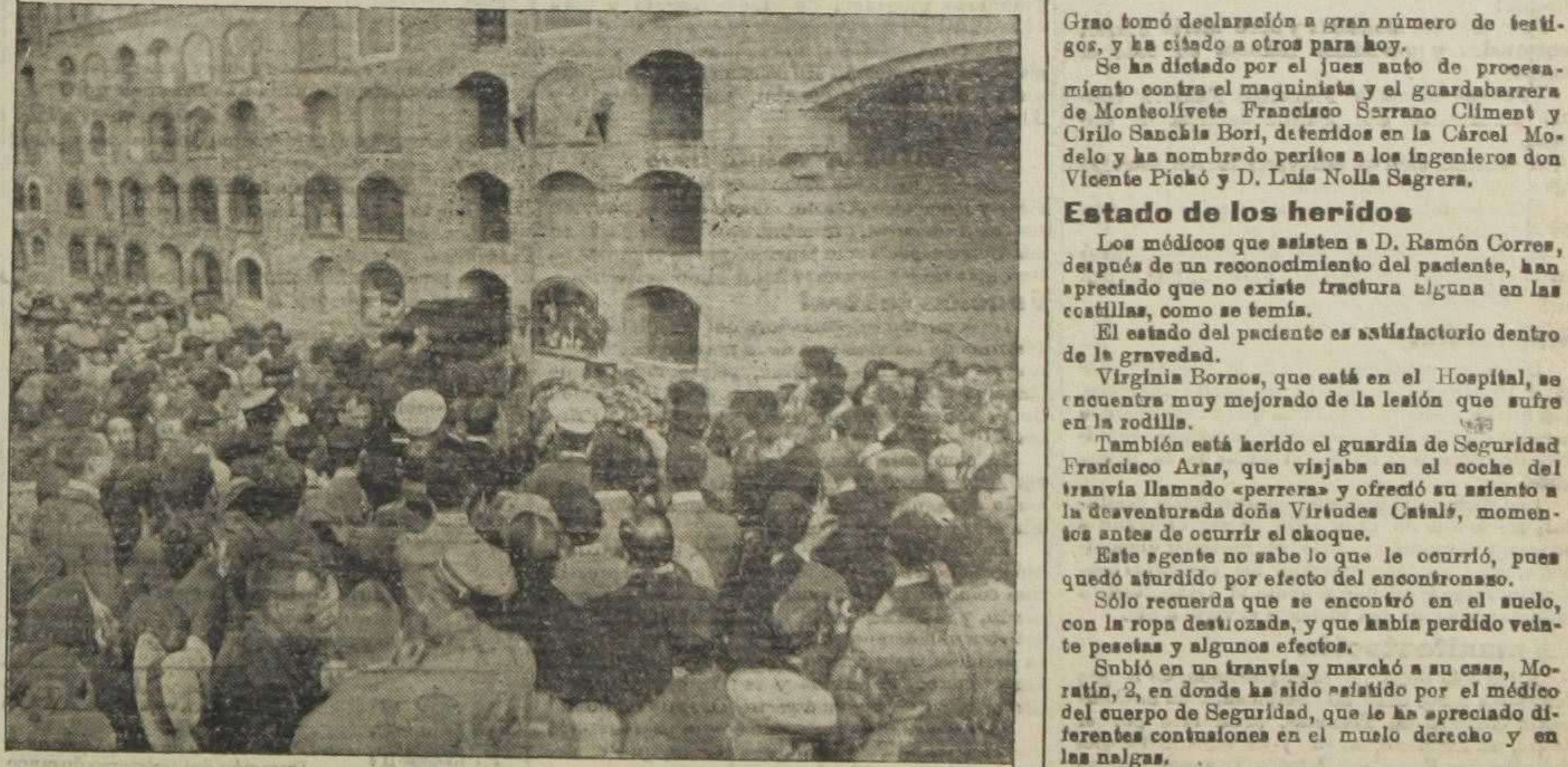
Colocación de los ferretros en los nichos.

muerto a consecuencia del choque del expreso contra el tranvía eléctrico