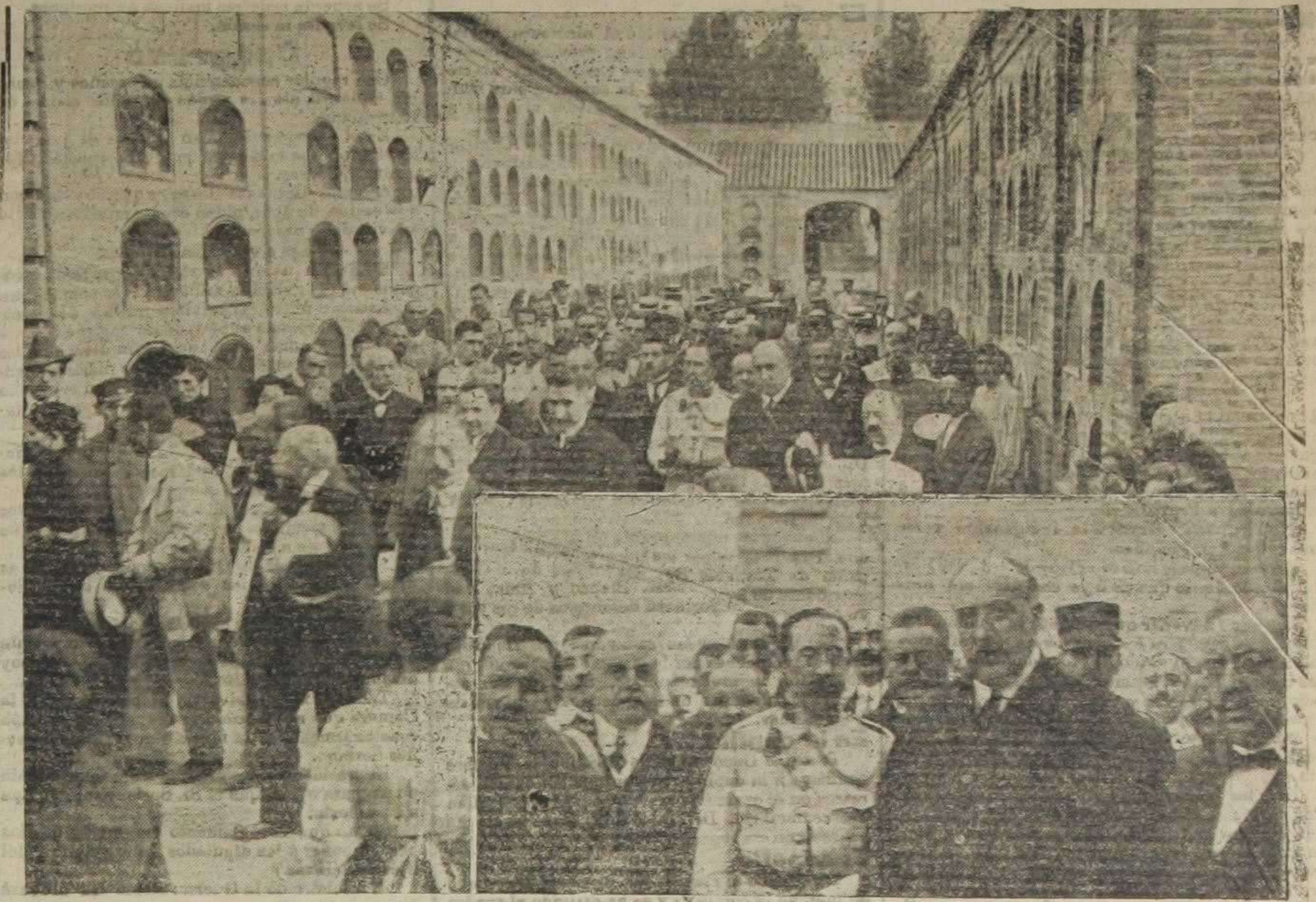
La manifestación a la llegada al Cementerio.—Grupo de las autoridades.—(Fotos. Gómez Durán y Vidal)