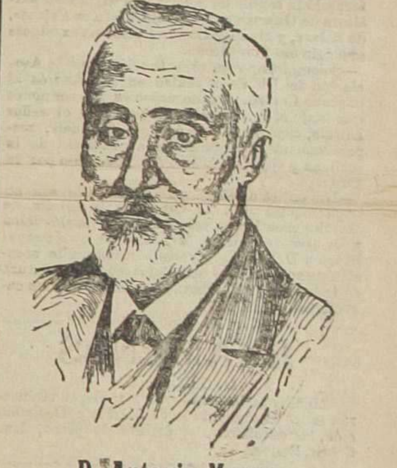
D. Antonio Maura que ha sido elegido por unanimidad académico de número de la de Bellas Artes de San Fernando