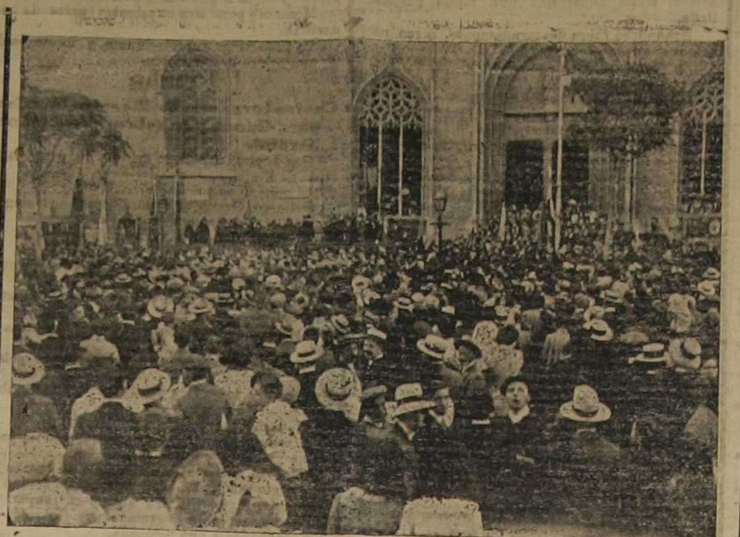
Plaza del Mercado.—Descubriendo la lápida de Romeu.