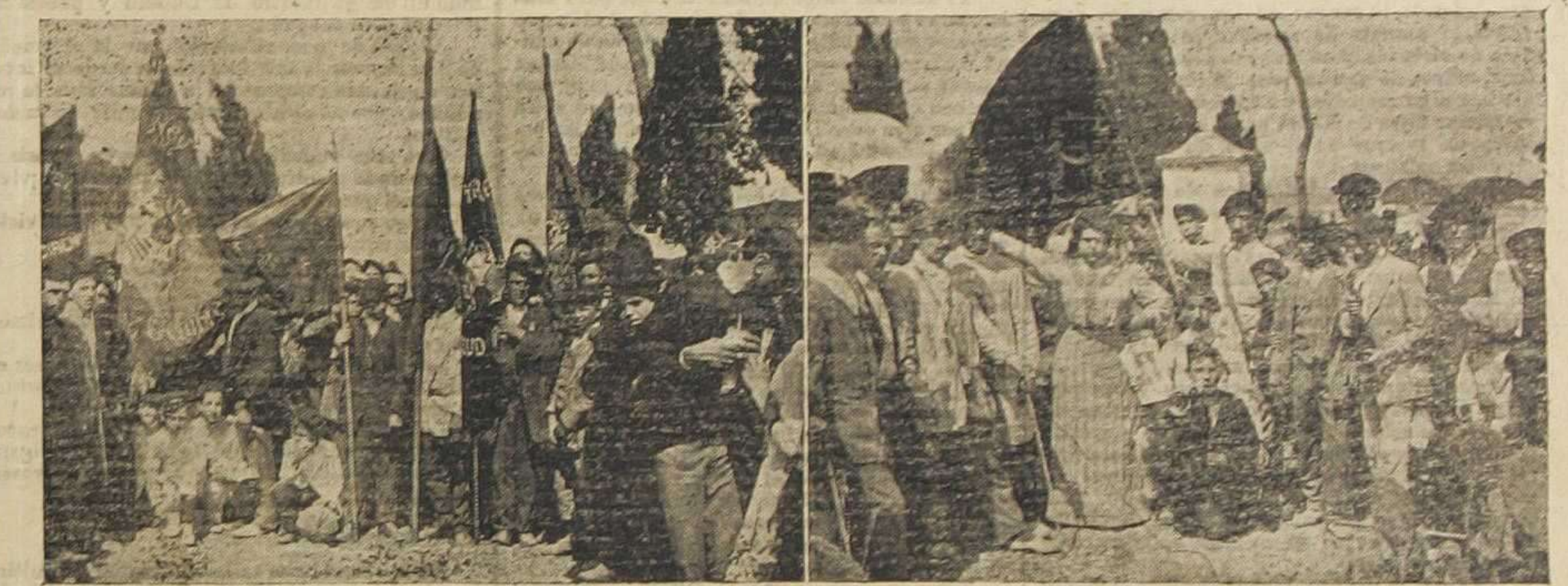
Grupos de las banderas en los alrededores de la Ermita.—(Fotos. Martín Vidal)

El cansancio y el tener que hablar por la tarde en el mítin le impedían extenderse más en aquel momento, y el Sr. Alción, con la elocuencia de todos conocida haría uso de la palabra.