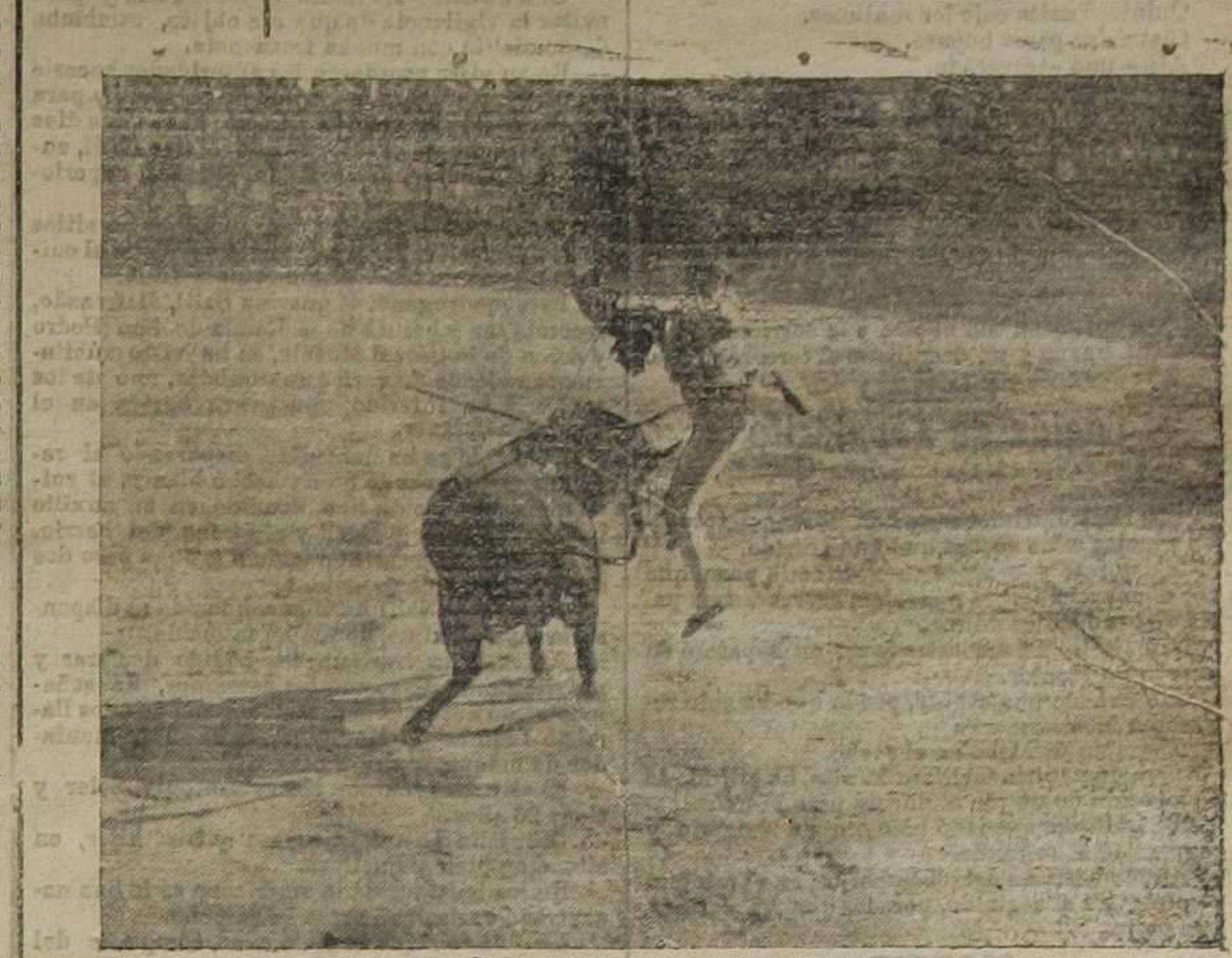
Cogida de Vazquez II en el primer toro de la novillada de ayer.