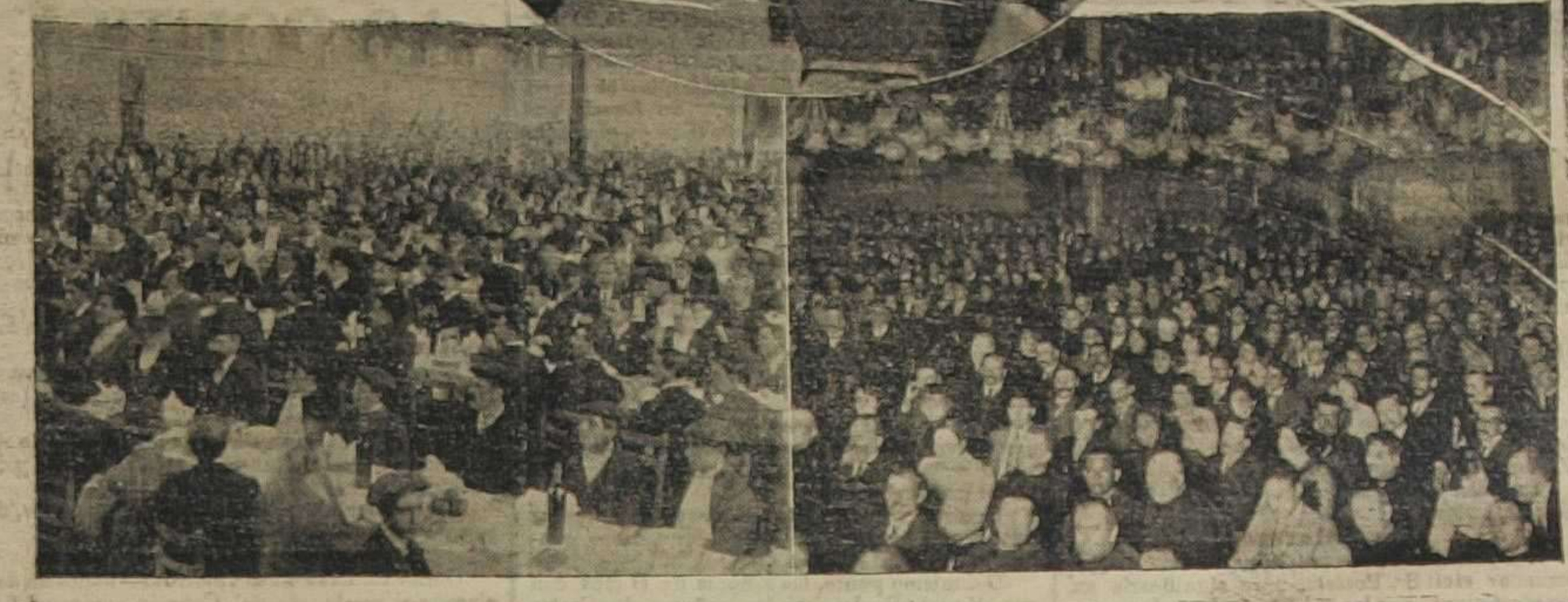
La Dinamarca republicana

De la brillantez de las fiestas celebradas con motivo de las reformas de El Correo Catalán , dan elocuente muestra los fotografías que hoy publicamos y cuyos originales debemos a los señores Bagná y Cornet, de Barcelona. El que ocupa la parte superior ofrece la reproducción exacta del momento en que dirige la palabra el elocuente orador legitimista D. Estebe de