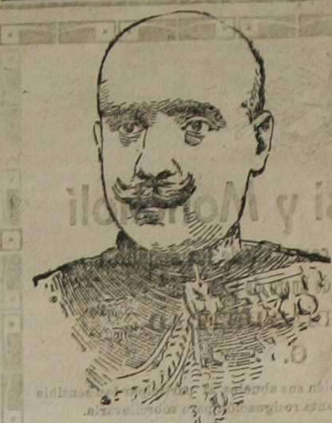
El general Gómez Jordana jefe de E. M. de la Capitanía General de Melilla.