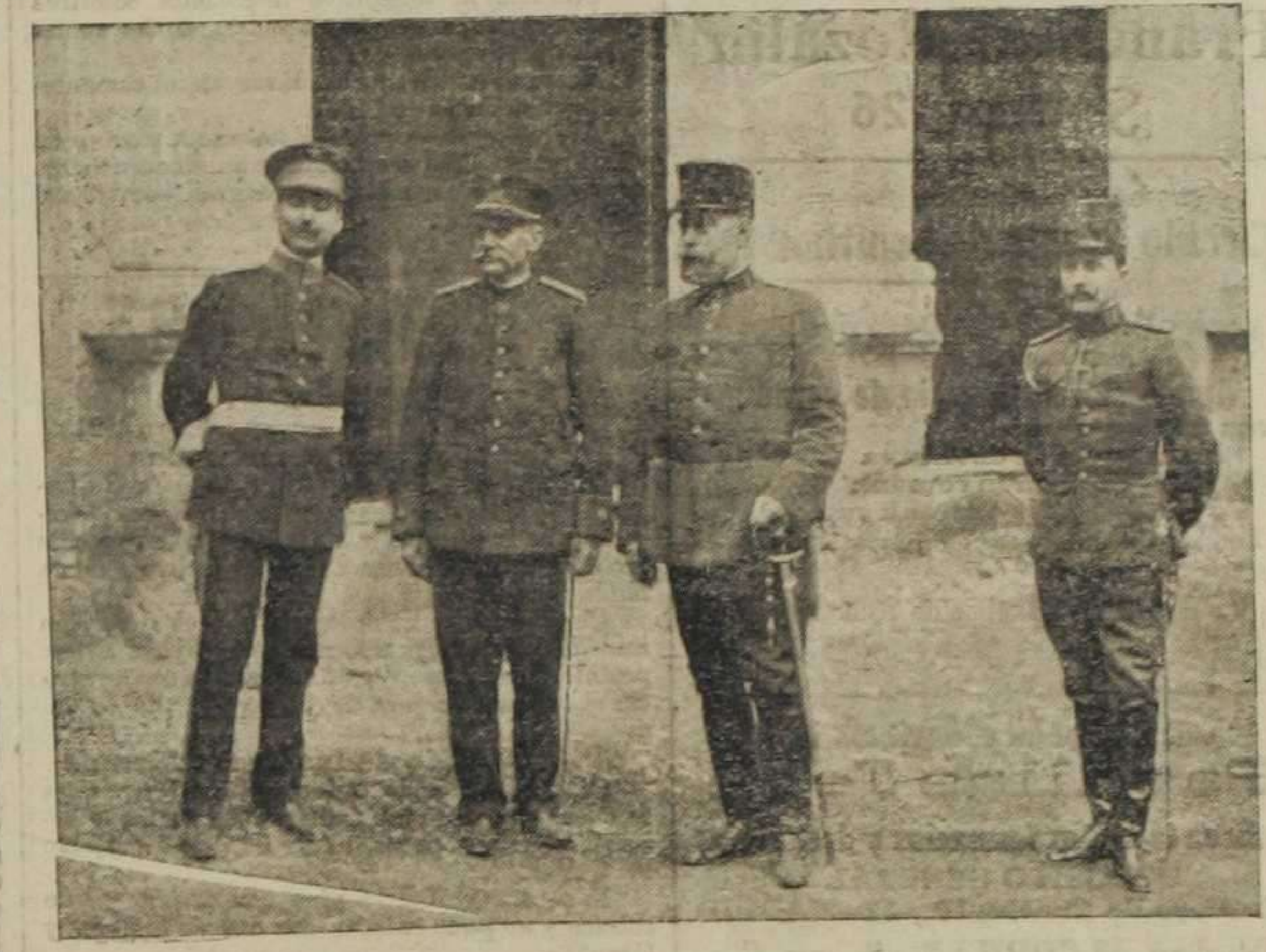
El general Carbó, con el coronel de las fuerzas de guarnición en Játiva, Sr. Comendador, su ayudante y el Sr. Caracciolo, en el patio del Ayuntamiento de Játiva.

Precauciones A la puerta del Ayuntamiento ha quedado instalada una guardia con fuerzas del regimiento de Otmuros. A la entrada se exige precisamente la exhibición del ticket de Prensa ó de invitado. Sin este requisito no entra nadie en la tribuna pública excepto gente suficiente para evitar aglomeración. En el piso bajo, junto á la escalera, se han situado dos parejas de civiles. En el primer tramo hay otra. Otras dos están á la puerta del salón.