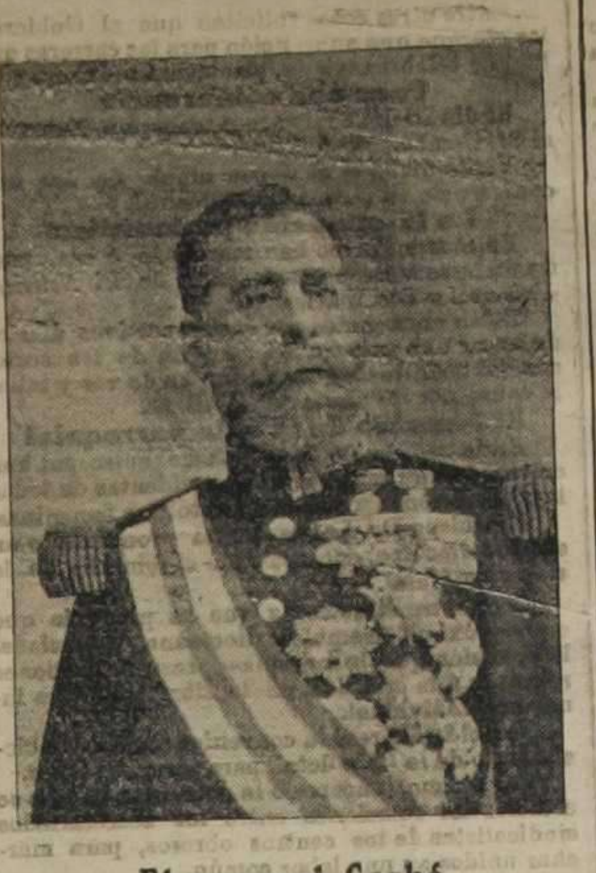
El general Carbó que mandará las fuerzas destacadas en Sueca.