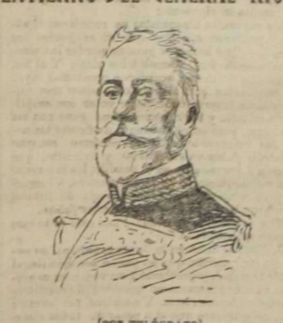
(POR TELÉGRAFO) Madrid 5.