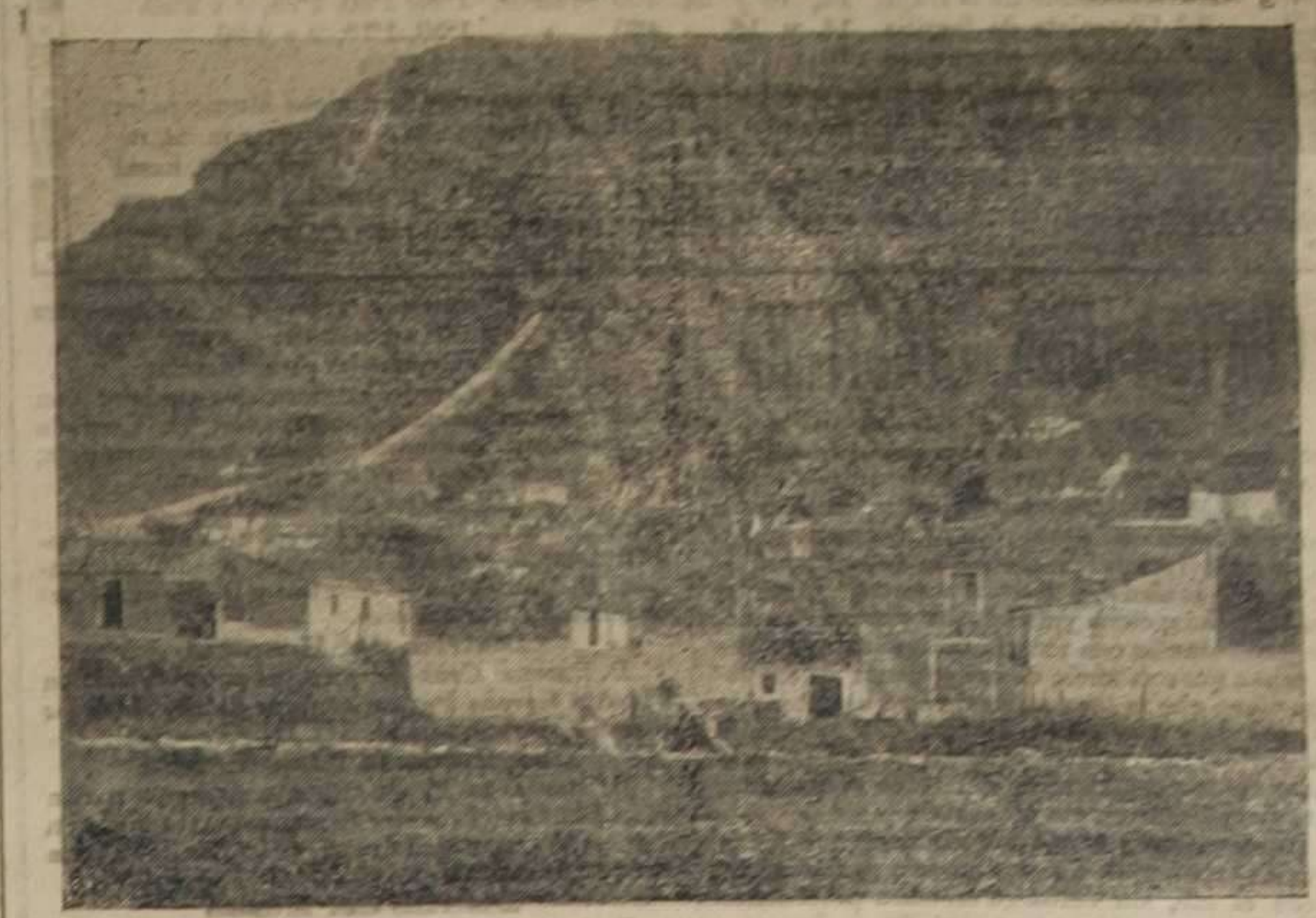
Vista parcial de Cullera, en donde se hicieron la mayor parte de las detenciones de los complicados en los asesinatos.