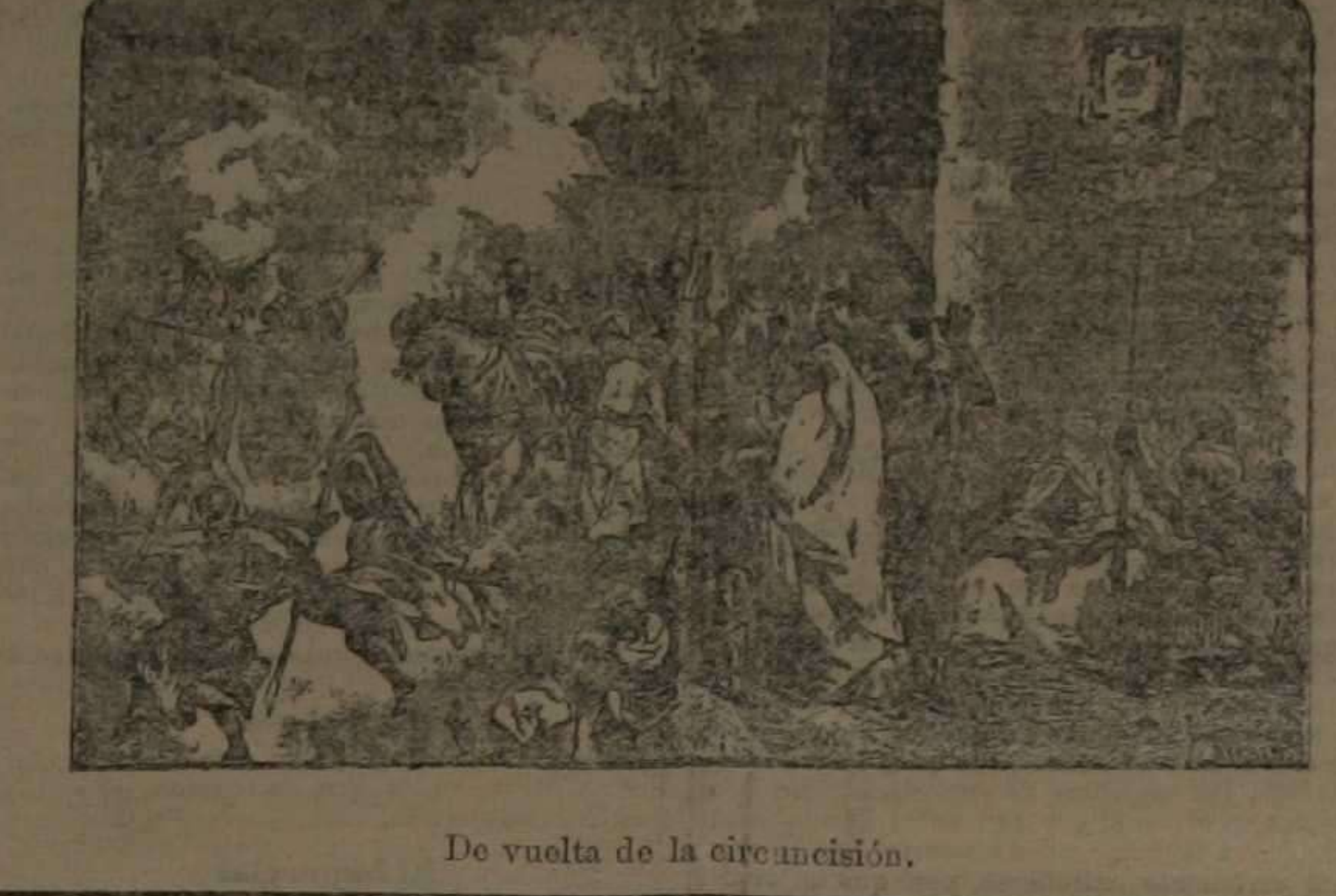
De vuelta de la circuncisión.