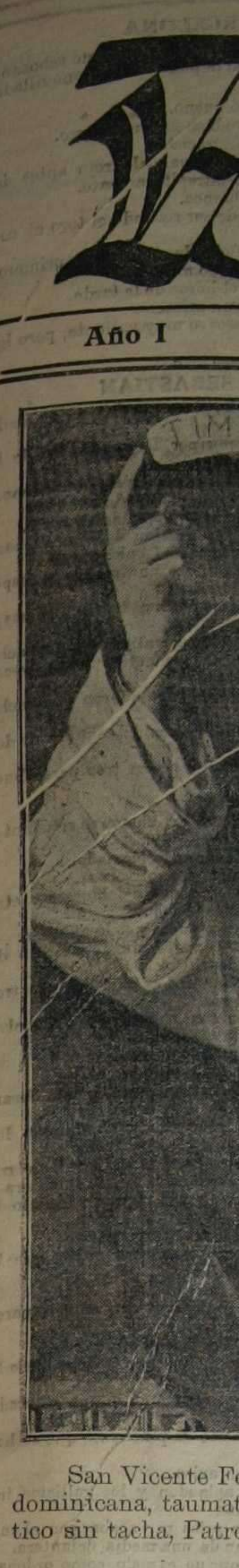
San Vicente F. dominicana, taumático sin tacha, Patro