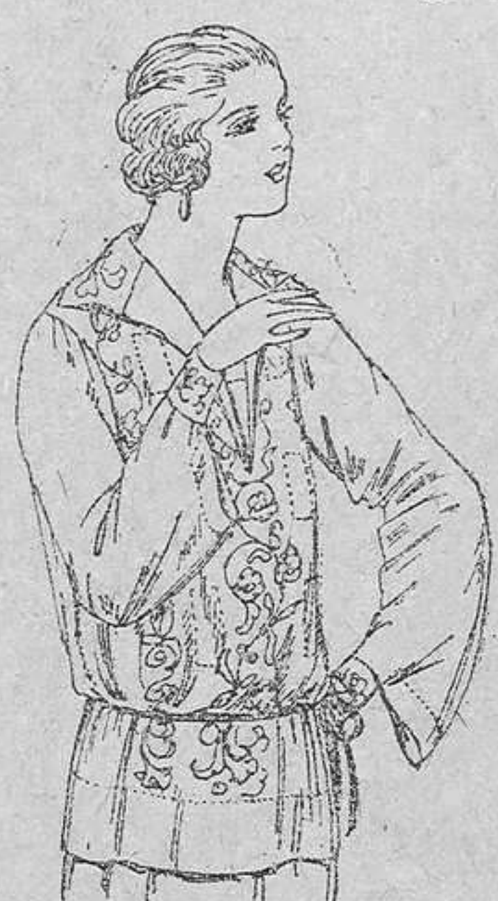
Blusas de voile de seda, en negro y blanco, adornos bordados. A pesetas 22.