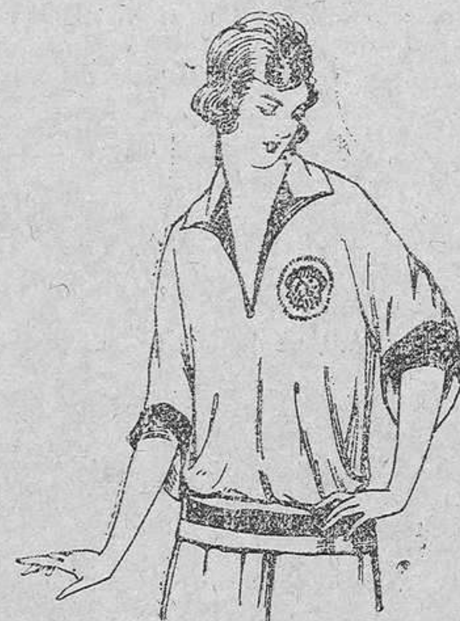
Blusas tricot de seda, en negro y colores, moda. A pesetas 39.