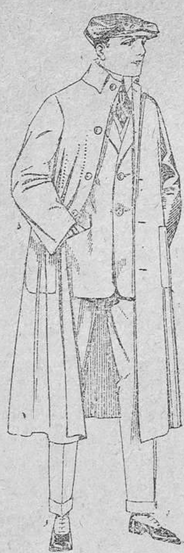
Guardapolvos de dril, igual al modelo. De pesetas 12 á 20.

Sucursales: Madrid, Barcelona, Alicante, Almería, Bilbao, Cádiz, Cartagena, Gijón, Granada, Málaga, Palma de Mallorca, Santander, Sevilla, Valladolid, Zaragoza