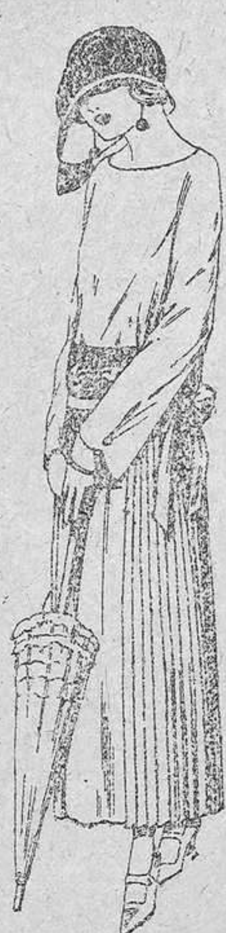
Vestidos de sarga inglesa, popeline, etc., en negro, azul y color, adornos bordados á mano. A pesetas 110.