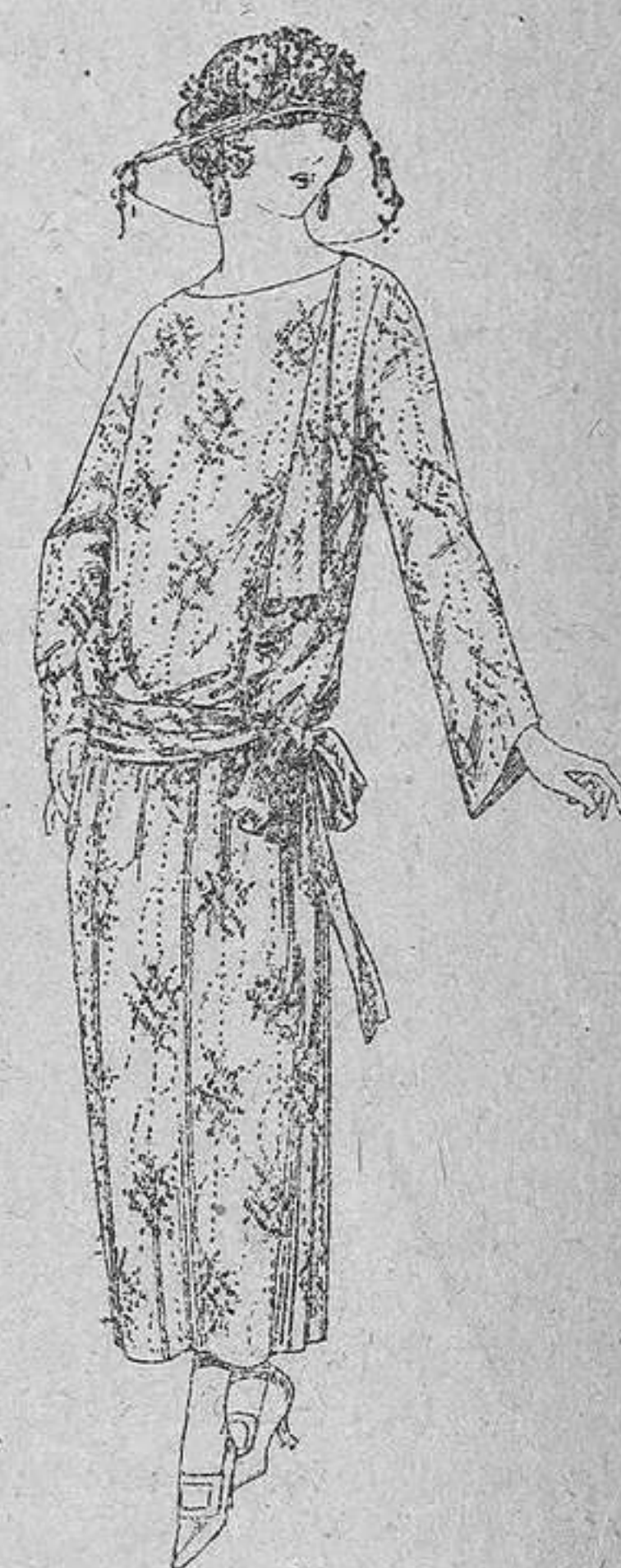
Vestidos de velo de algodón, dibujos novedad. A pesetas 50.