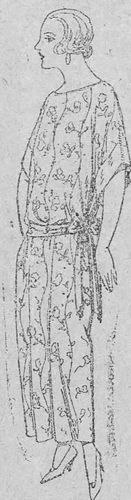
Batas de crepón, en negro y colores, adornos bordados. De pesetas 32 á 38.