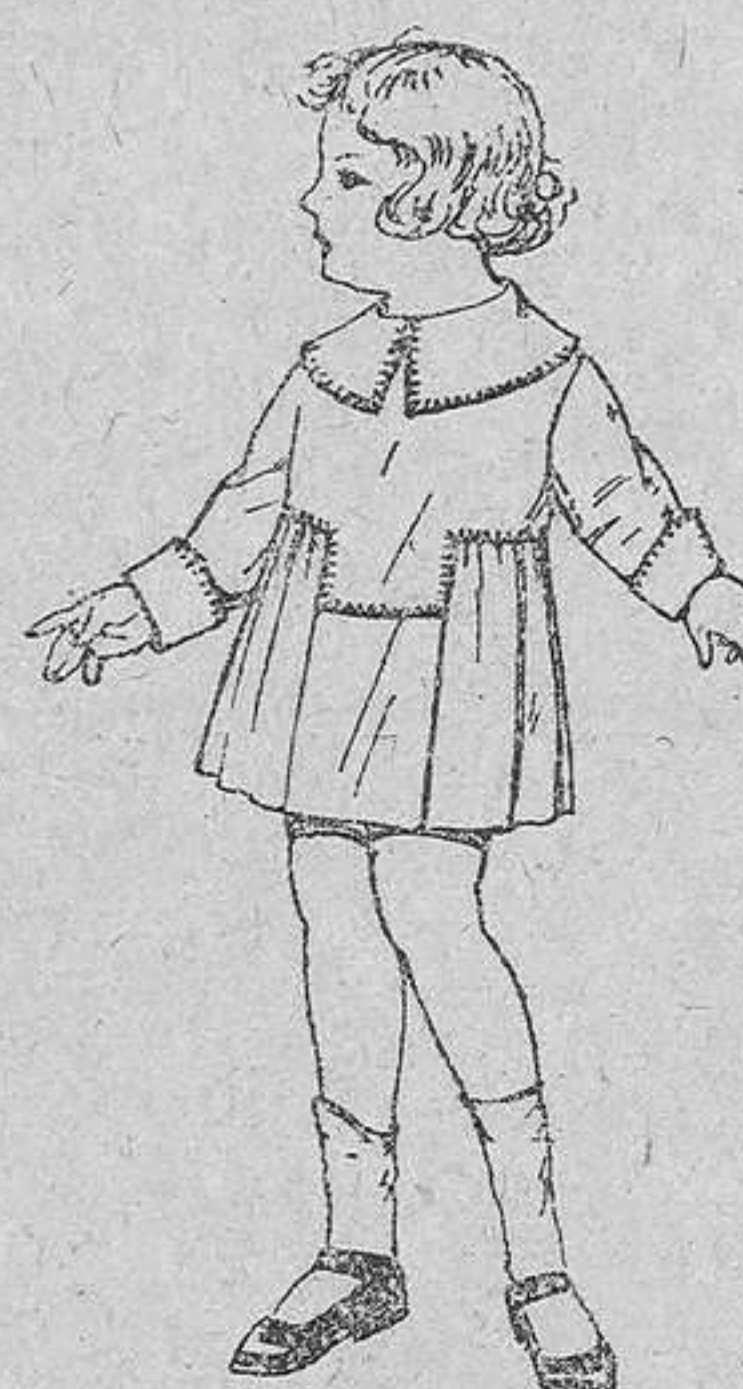
Vestidos batista blanca, pespunte de adorno, para niñas de 3 á 6 años. De pesetas 5'50 á 6'50.