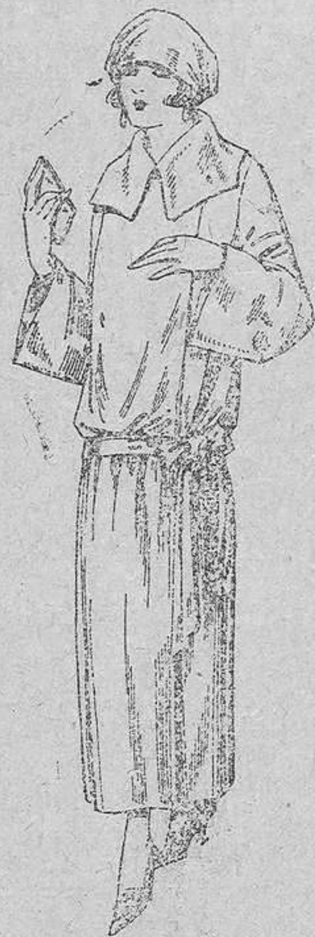
Guardapolvos de dril crudo, gris, beig, etc. De pesetas 18 á 25.