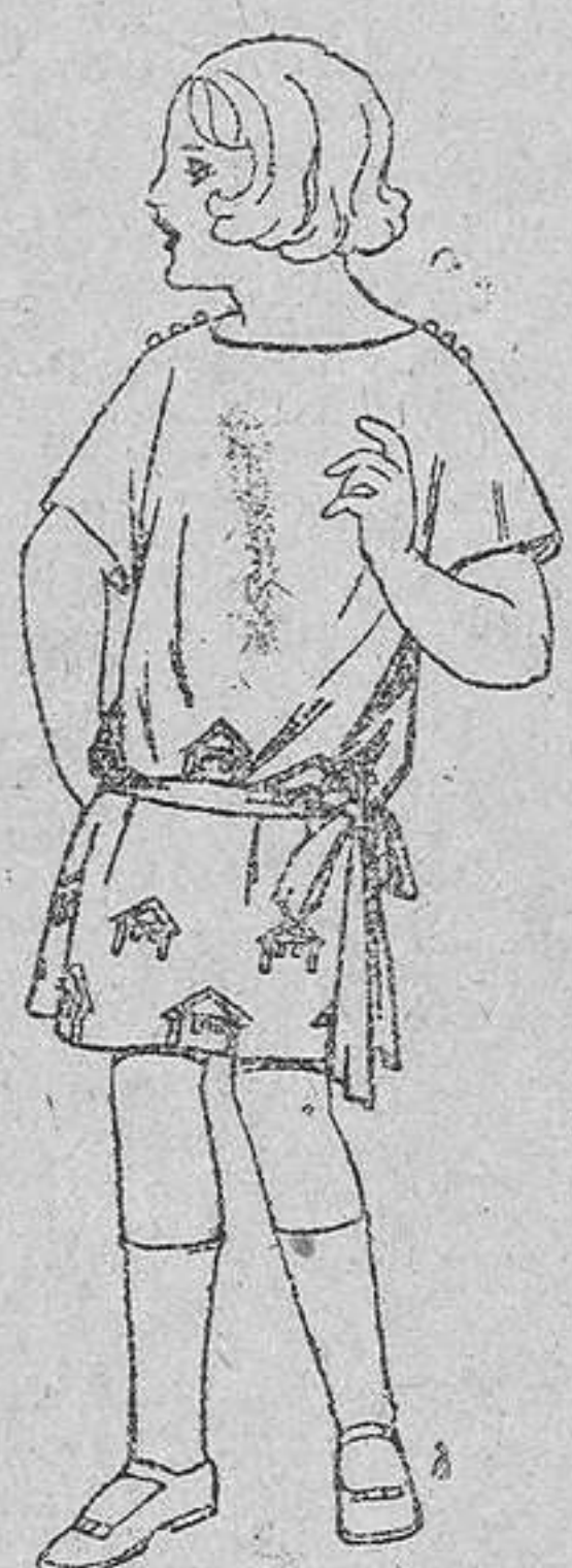
Vestidos popeline, sarga inglesa, etcétera, adornos bordados, para niñas de 4 á 9 años. De pesetas 30 á 35.