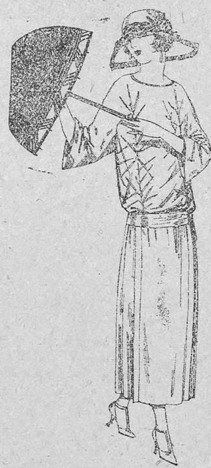
Vestidos de tricot de seda, en negro, azul y colores moda, adornos bordados. A pesetas 115.