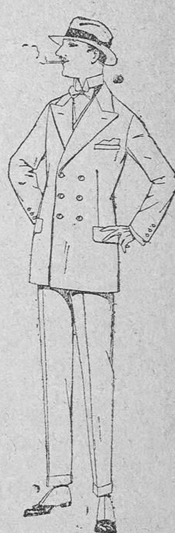
Trajes de lanilla, melton, estambre, vicuña ó jerga. De pesetas 40 á 140.