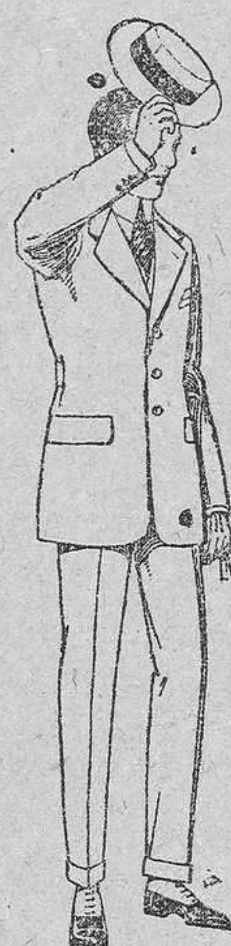
Trajes modelo sport, de lanilla, melton, etc. De pesetas 75 á 100.