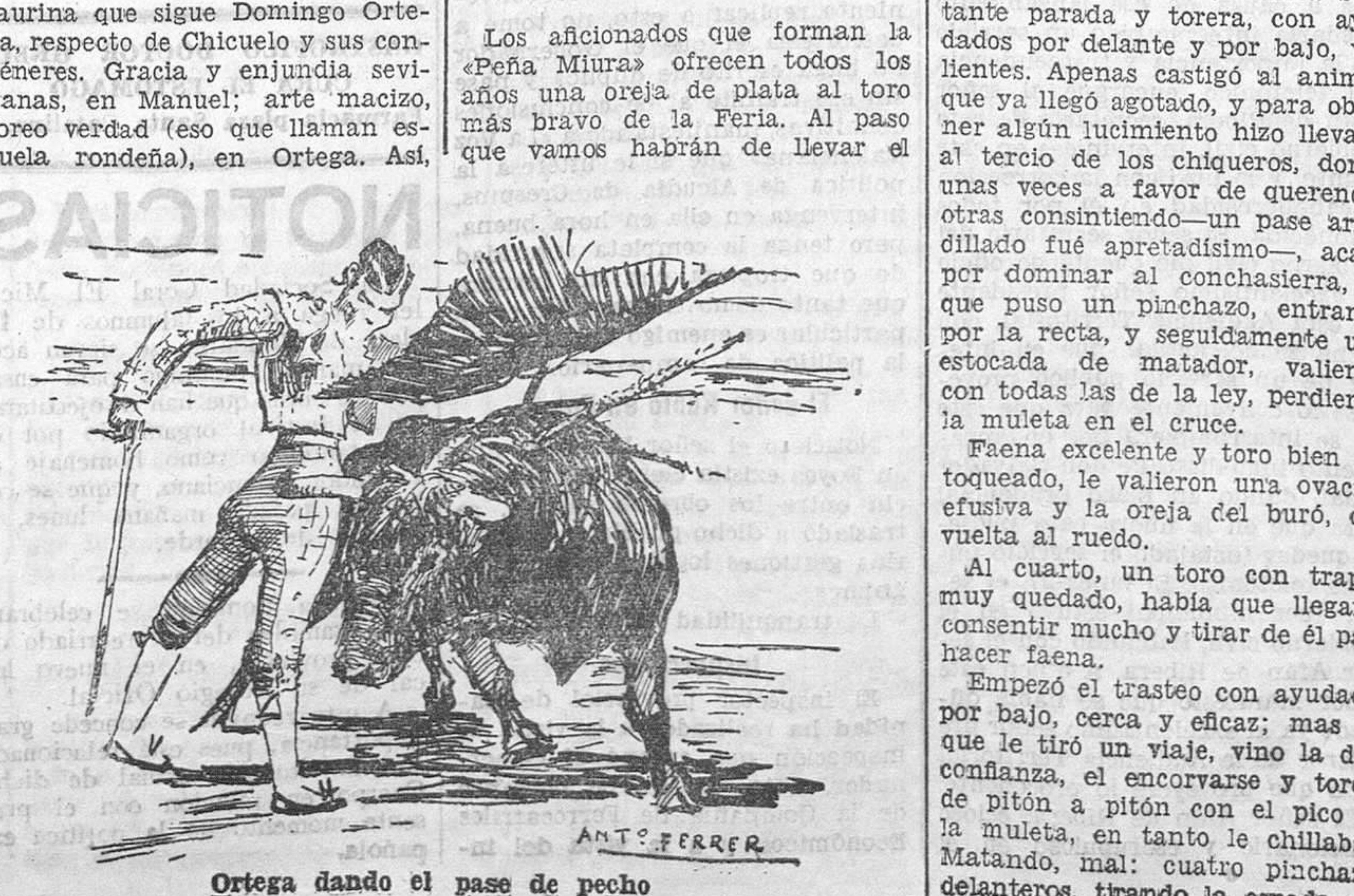
Ortega dando el pase de pecho