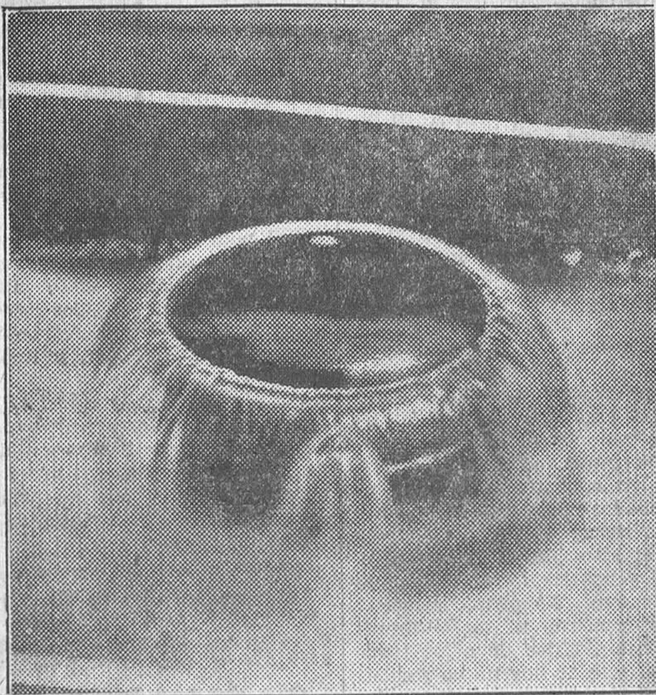
Cómo brotó el agua el 7 de Julio último, y cómo continúa saliendo en la actualidad

Seguramente estas aguas atravesaban capas areniscas ricas en cloruro de sodio. Su temperatura