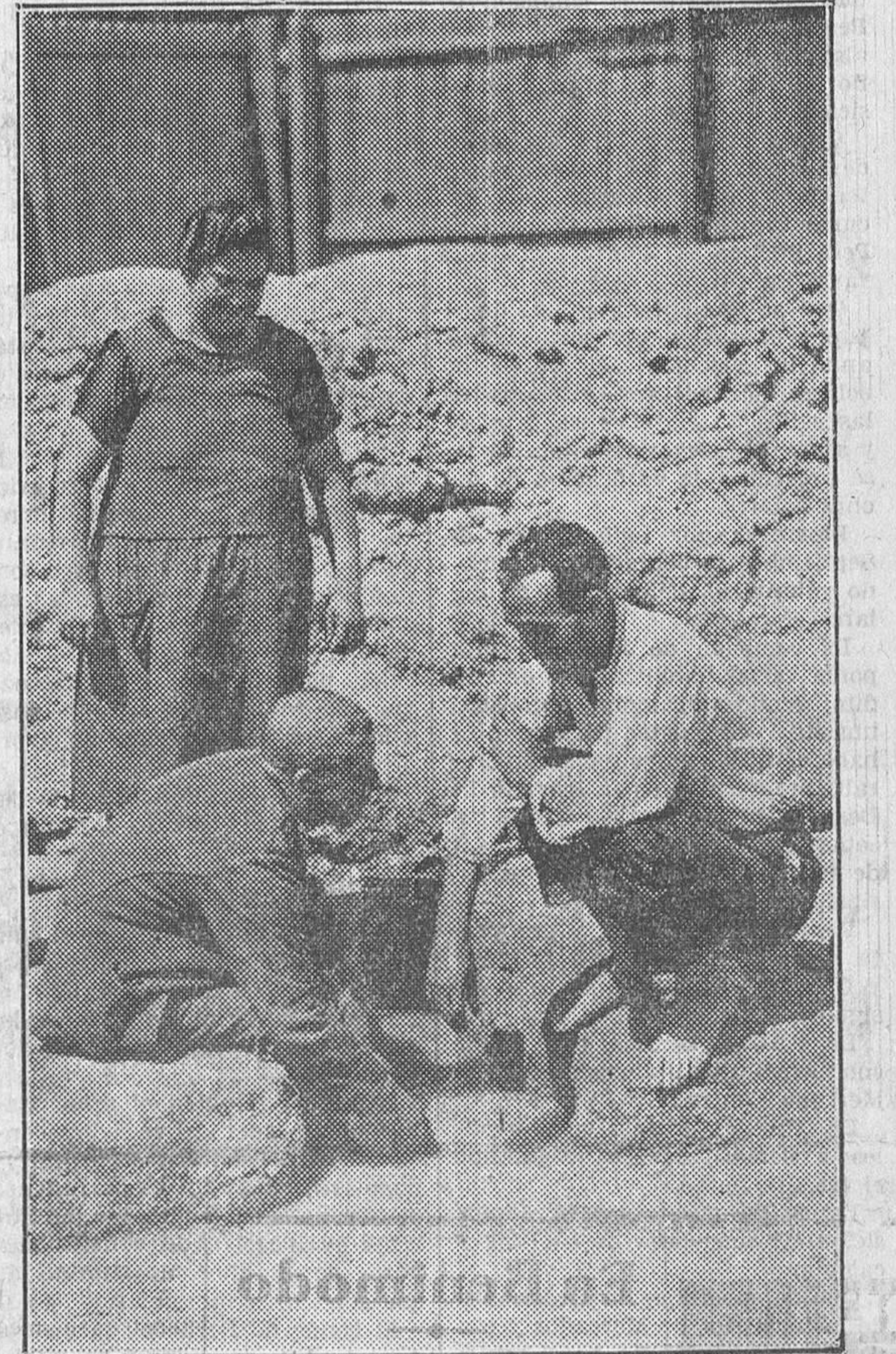
Unos asiduos concurrentes al moderno balneario, en la hora del baño... de pies

Esta era una de las finalidades de la perforación; ahí estaba el motivo que había informado los estudios geológicos y la aspiración de los técnicos que dirigían los trabajos. Llevados éstos a los 180 metros, en vez de agua, la perforación ofreció bien distintos caracteres.