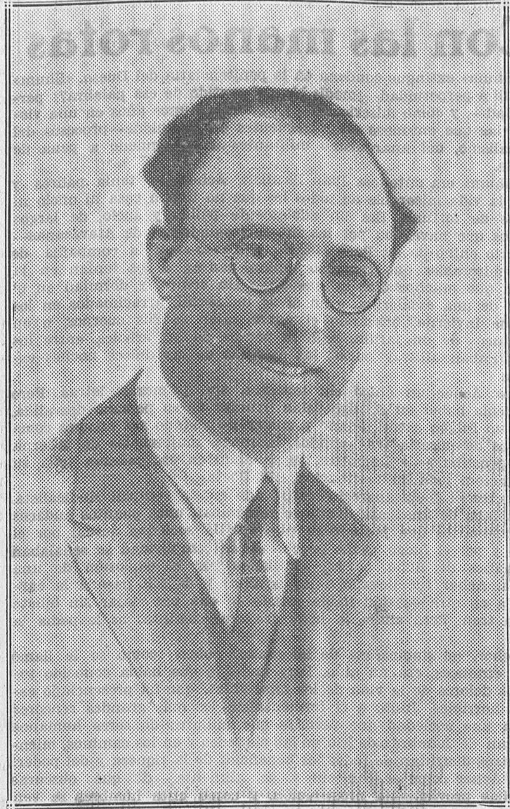
EL MAESTRO VERT