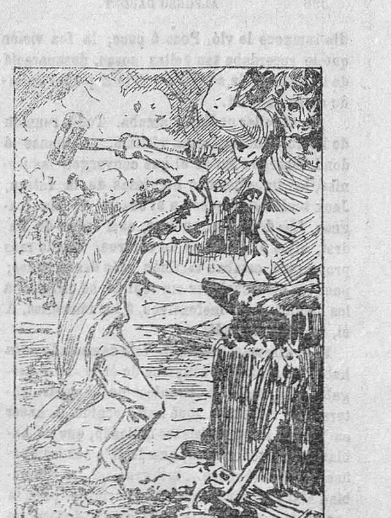
—¡Eh, Asteca, duro, firme ahí, hijo! ¡mío!

Leía, pero muchas veces los libros del señor Rivals eran demasiado profundos para él y no estaban a su alcance; no le dejaban, por decirlo así, más que semilla de buen grano todavía seco, pero que el buen tiempo haría germinar. Entonces se interrumpía a sí mismo, se extendía soñando y despertaba al ruido del agua en las piedras ó al movimiento regular de las alas que descendían.