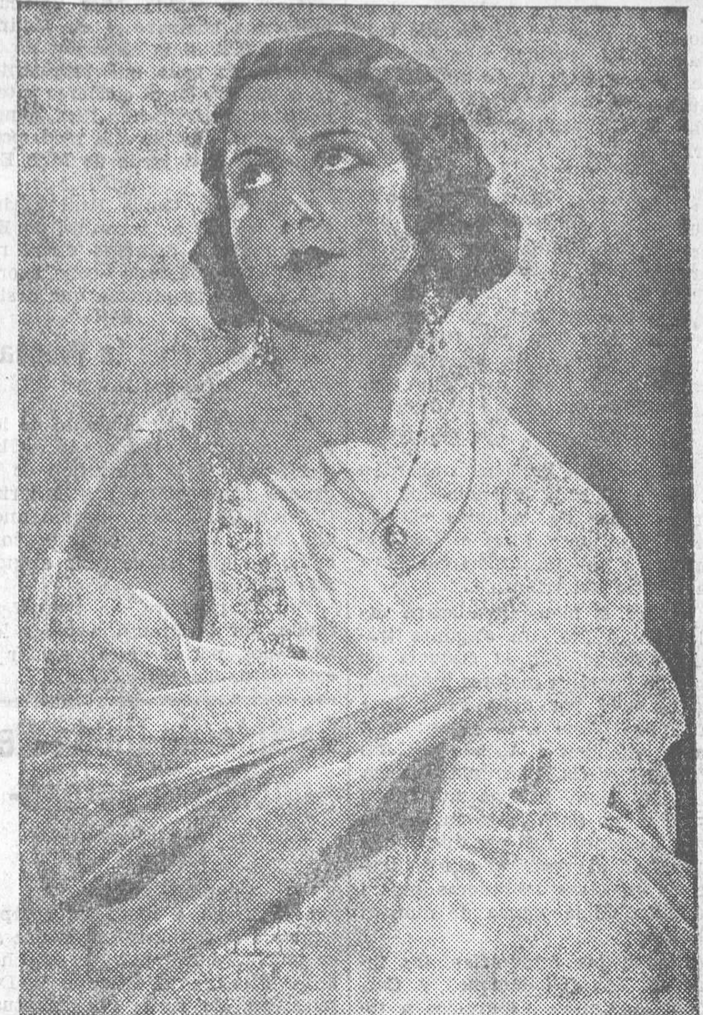
MISS VALENCIA YA FUE ELEGIDA Y CAMBIO SU ATUENDO POR ELEGANTE TRAJE DE NOCHE QUE REALZA SU HERMOSURA