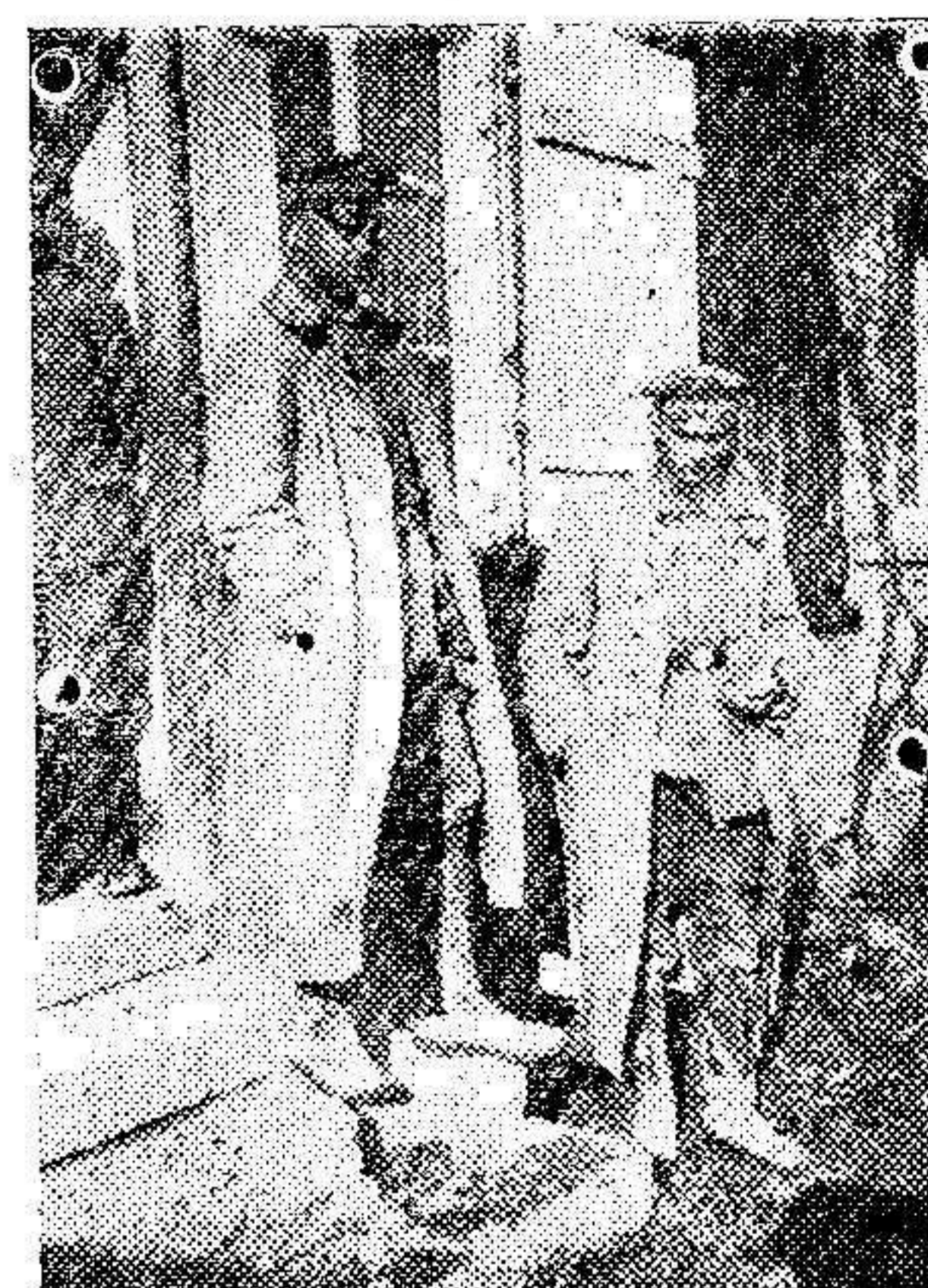
Soldados alemanes aguardando el paso de un contingente de prisioneros con destino al campo de concentración de Verdun

En la región de Tabaí la invasión se extiende actualmente hasta Kenitra y por el Sebú.