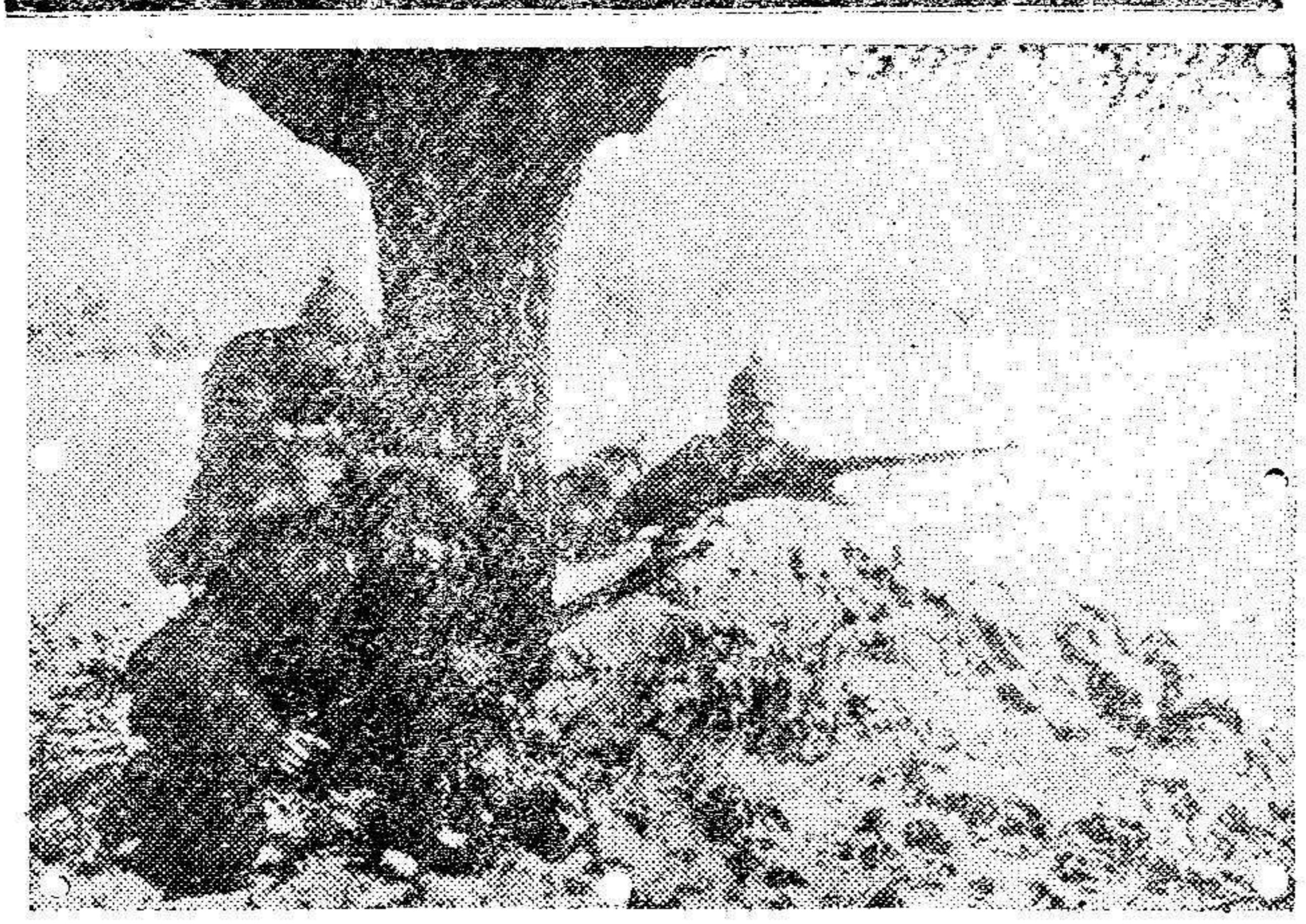
Vanguardia alemana en las cercanías de los Lagos Mazurianos.