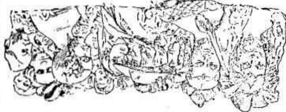
Detalle de la lápida colocada en la casa en que murió Espronceda

El zócalo, como los remates superiores de las pilastras, completan el bello y artístico conjunto de la lápida.