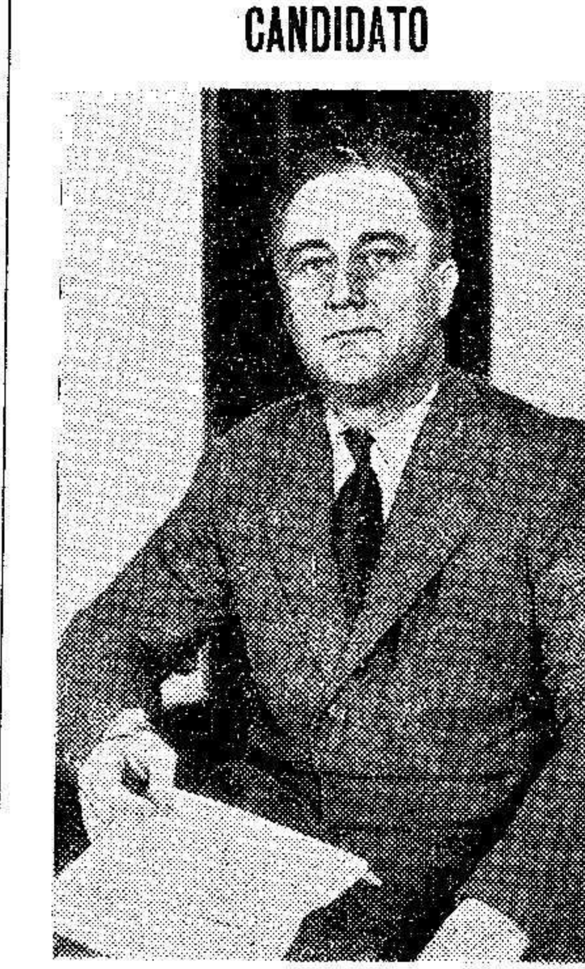
Franklin D'Roosevelt, que parece tener las mayores probabilidades para ser designado candidato presidencial en la convención de demócratas, que se verificará el próximo 27 del actual.