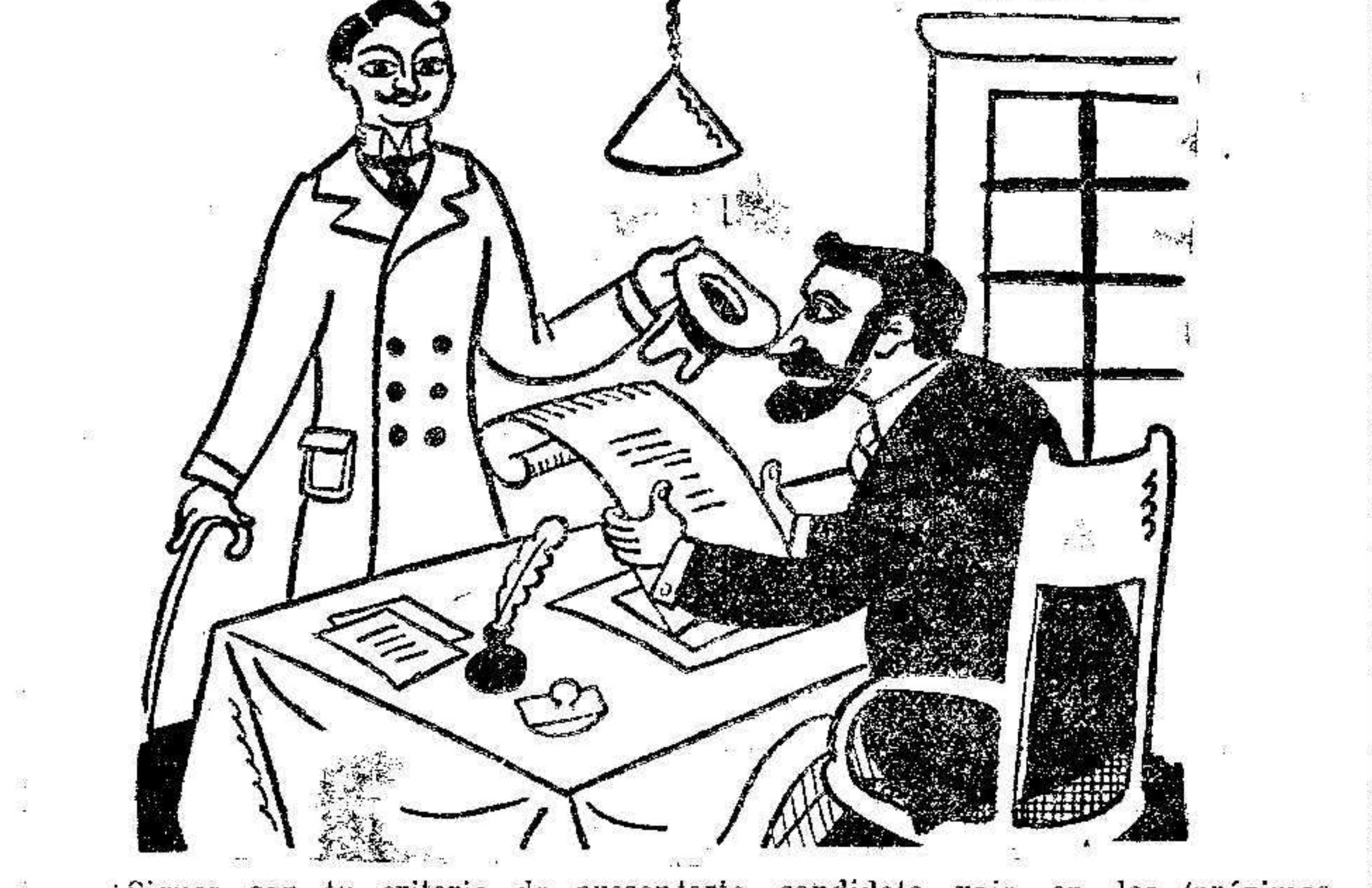
—Sigues con tu criterio de presentarte candidato rojo en las próximas elecciones? —Sí, pero me parece que todavía estoy un poco verde.