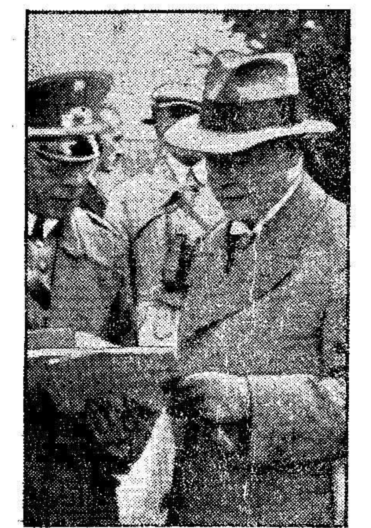
M. Groener, ex ministro del Reichstag, que ha hecho cuestión de gabinete la disolución de las tropas de Hitler.