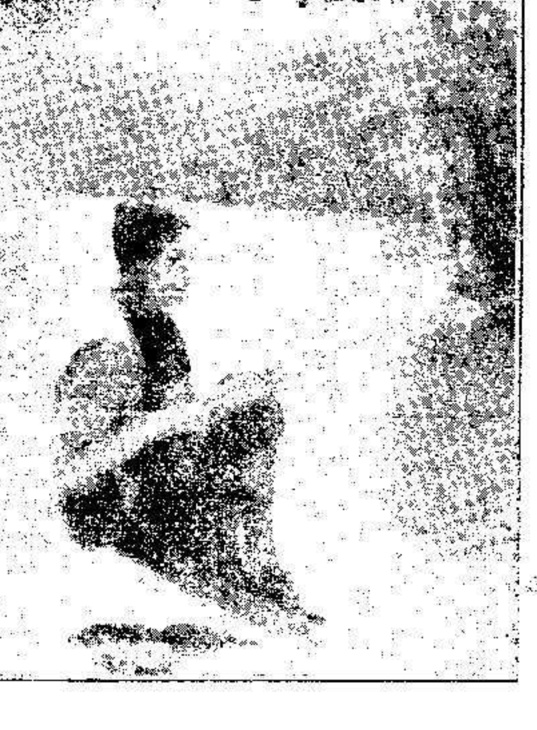
Greta Garbo, se distrae con el atractivo de la pesca