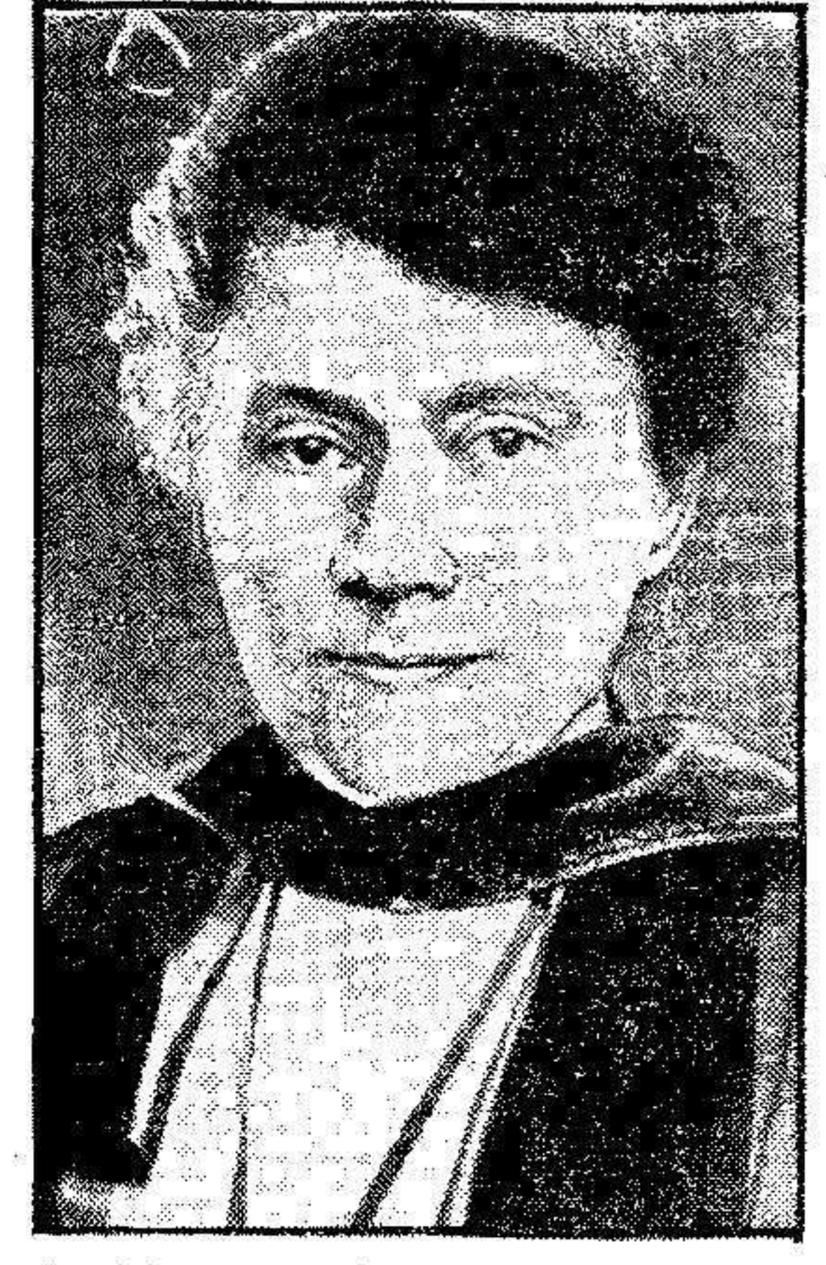
También la mujer, que paso a paso va ocupando los puestos políticos más destacados...