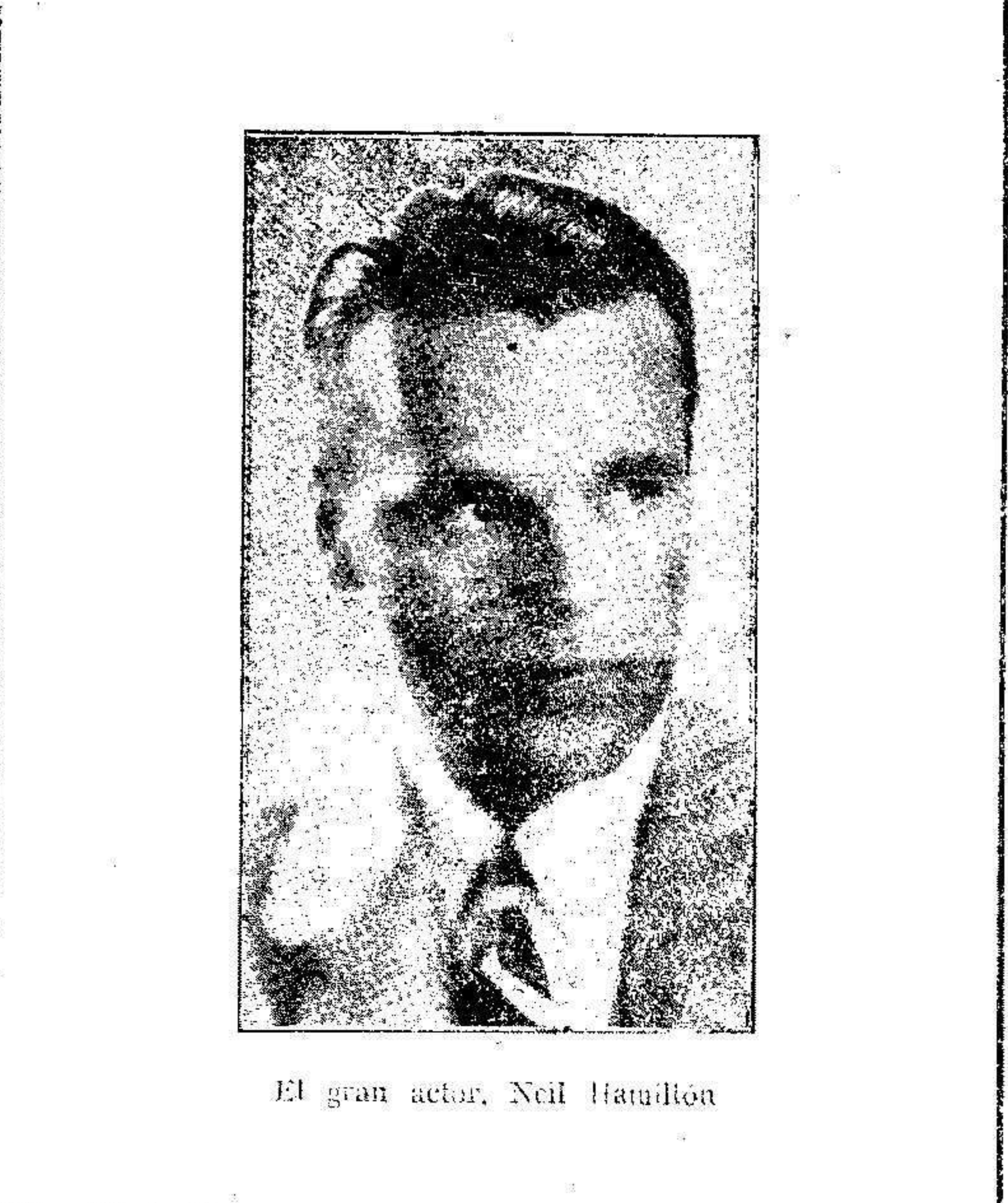
El gran actor, Neil Hamilton