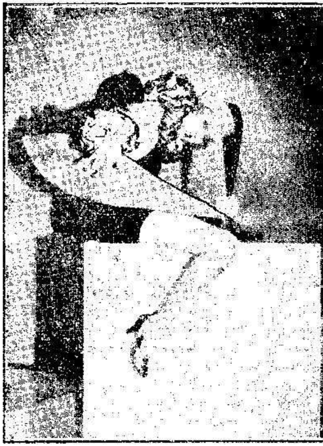
Anita Page, actriz de la M. G. M. llevando con su gracia característica esta modernista indumentaria de ballets en blanco y negro.

me a aquí mi régimen dietético: Por las mañanas, jugo de naranja; al mediodía, una ensalada de carne o de puerco, ensalada de frutas y café sin azúcar; por la noche, jugo de naranja con un huevo, batido. Este sistema, aplicado rigurosamente durante una semana, me da los mejores resultados. Y a la vez mejora el color de mi cutis. Hay que hacer ejercicios, sin exceso. Fumo poquísimo. El café y el té, los tomo siempre sin azúcar y me encantan. El espejo no lo consulto demasiado. Me gusta preguntar sus opiniones sobre su manera de vestir a alguna de mis amigas.