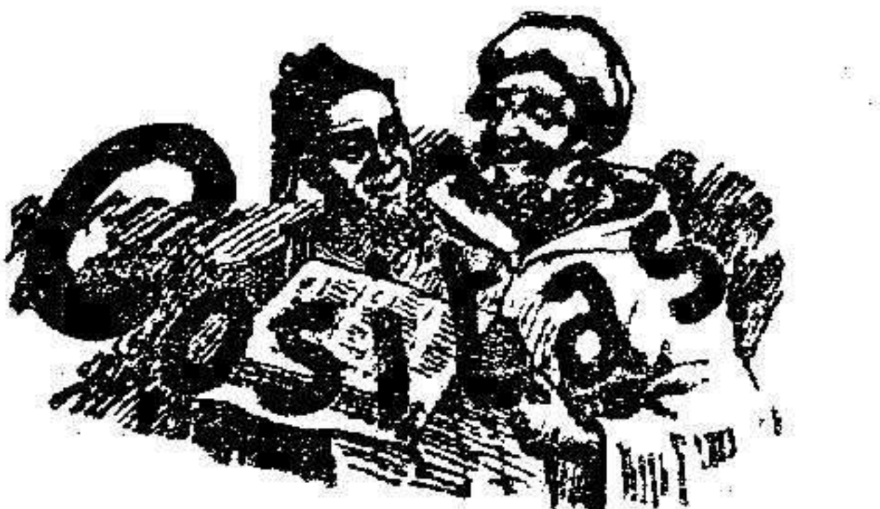
LA INGRATITUD DE ROSARIO