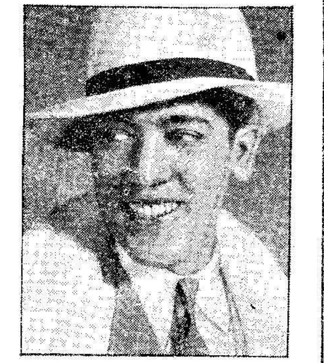
El célebre cantante José Mejía, que en el primer fila hablo, obtuvo resonante éxito y que actualmente prepara tres más que se conocerán en la próxima temporada.