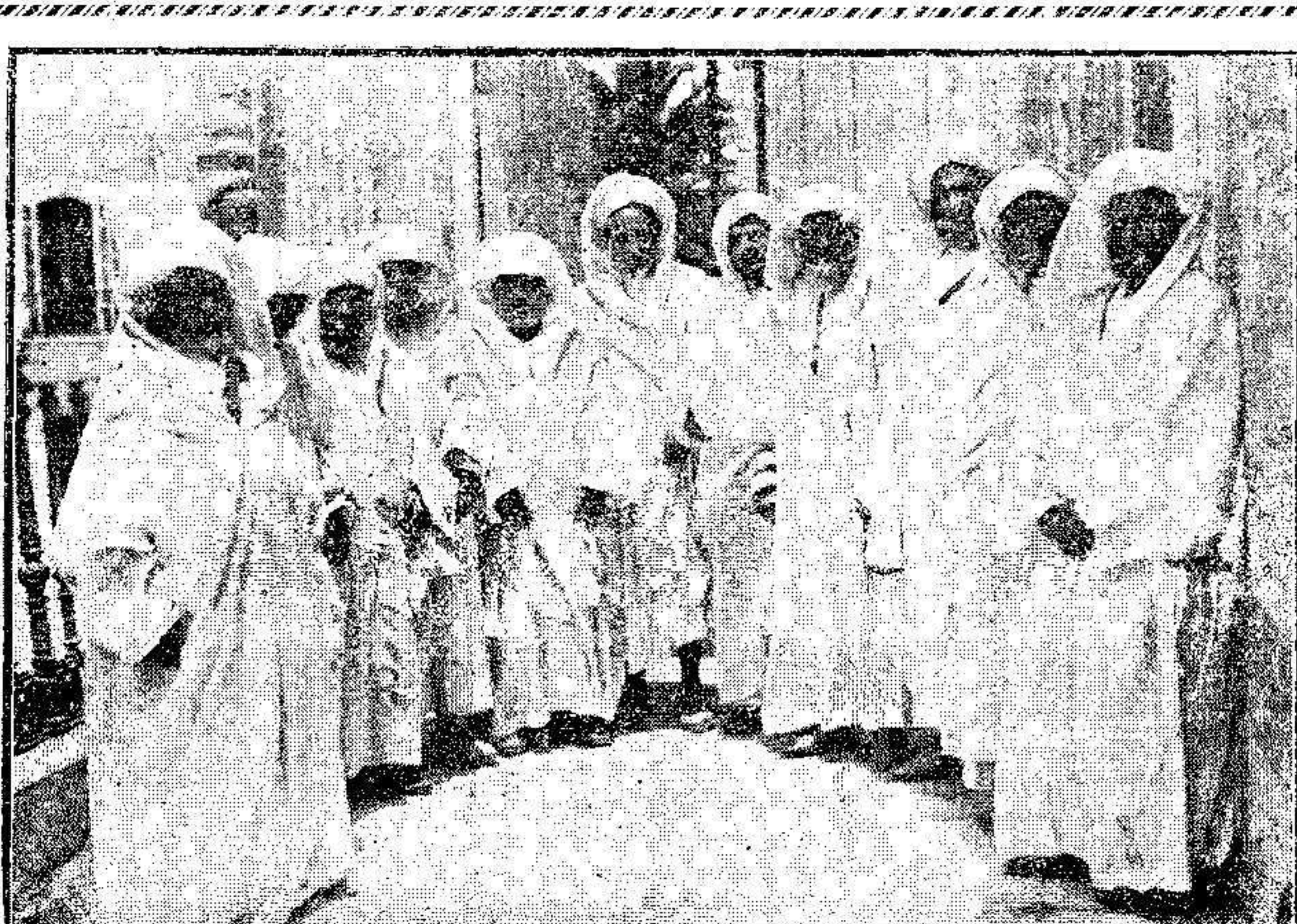
DE LA VISITA DEL ALTO COMISARIO