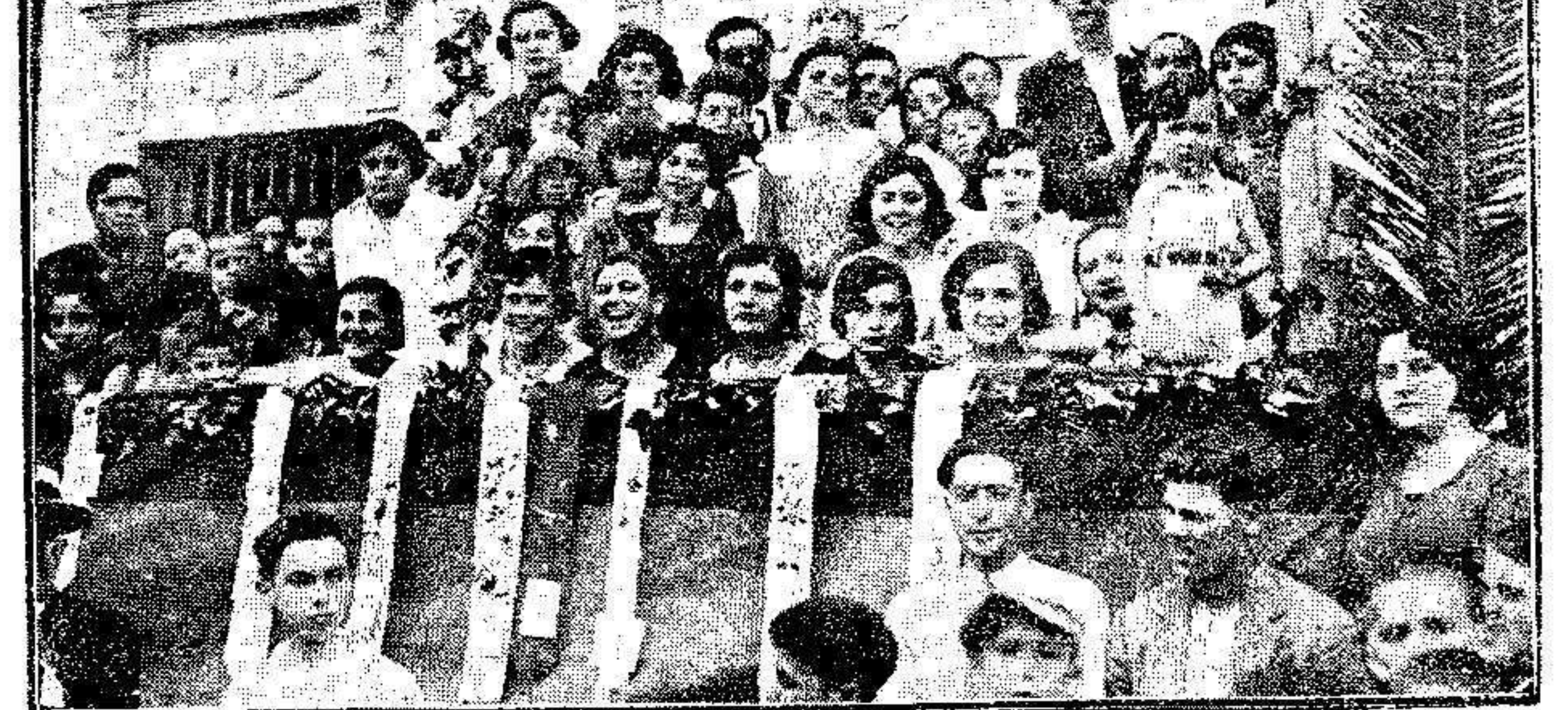
Bellas señoritas del simpático barrio, que bordaron las cintas para las carceras de bicicletas.

Una mujer víctima de dos curanderos. Casablanca 20. Una mujer mora estaba obsesionada por el deseo de ser madre, fracasando cuantos medios puso en práctica para ello.