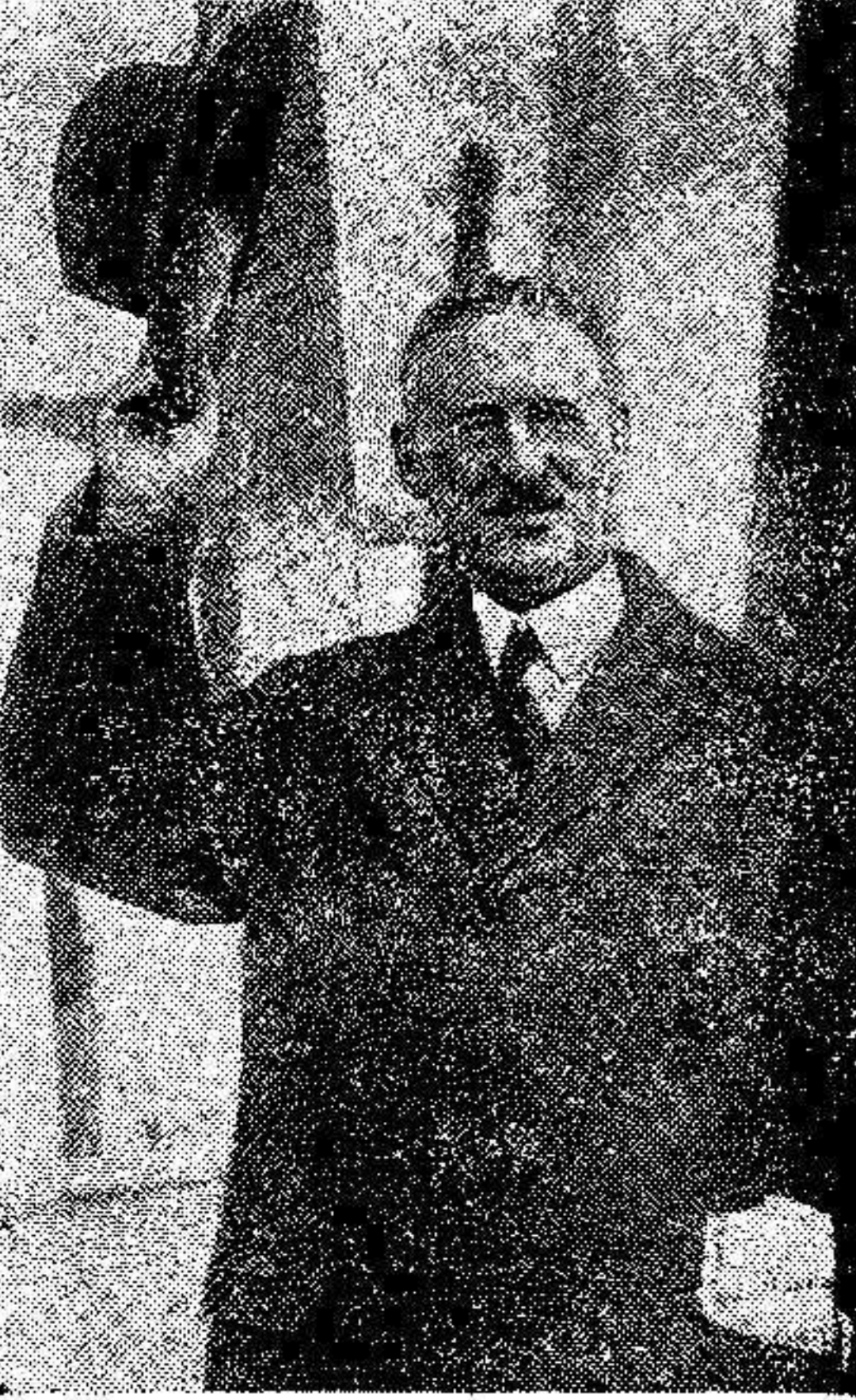
Mr. Henry Stimson, ministro de Negocios de Estados Unidos, que durante su visita a Europa participa en las negociaciones con los hombres de Estado europeos, con motivo de la proposición Hoover.